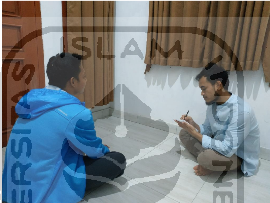
Dokumentasi 1: wawancara dengan bapak Suherman (nama samaran)