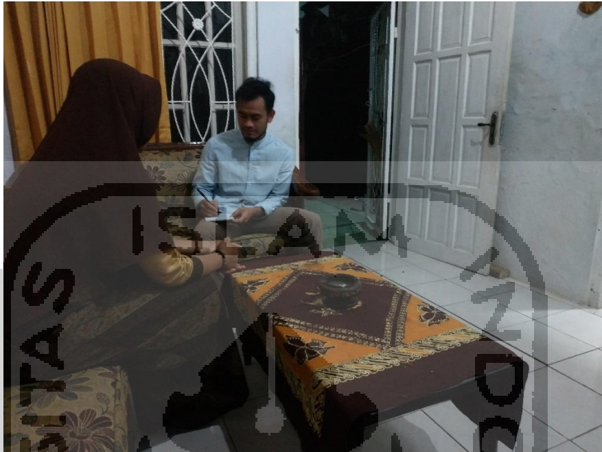
Dokumentasi 3: wawancara dengan ibu Muna (nama samaran)

UNIVERSITAS ISLAM INDONESIA UNIVERSITAS ISLAM INDONESIA UNIVERSITAS ISLAM INDONESIA