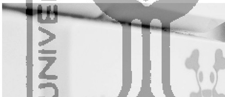
Gambar 1.1 Berita Serangan Siber di Indonesia

Serangan siber dilakukan dengan berbagai motivasi, salah satu motivasinya adalah cybercrime , menurut data yang diambil dari website hackmageddon.com menyebutkan pada bulan Mei 2018 sebesar 81% serangan dilakukan dengan motivasi tersebut ( hackmageddon.com ). Hal ini menempatkan cybercrime pada posisi pertama sebagai motivasi paling banyak dilakukan.