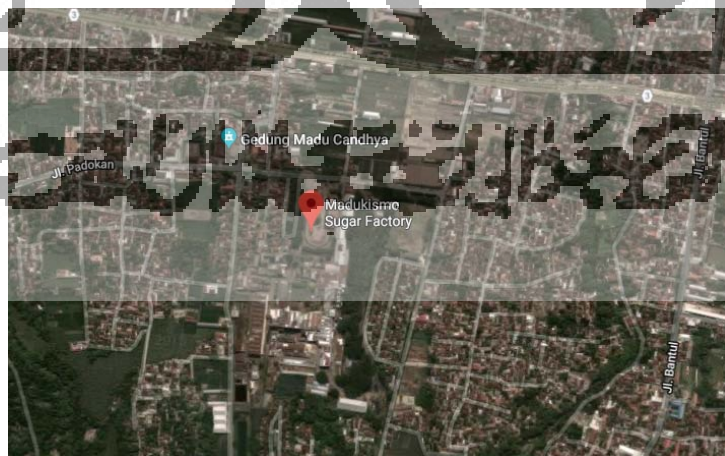
Gambar 3.2 Lokasi PT Madubaru Madukismo

Lokasi penelitian dan pengambilan data dilakukan di PT Madubaru Madukismo, beralamat Tromol Pos 49 Padokan, Tirtonirmolo, Rogocolo, Tirtonirmolo, Kasihan, Bantul, Daerah Istimewa Yogyakarta, atau menggunakan koordinat berikut-7.8310642,110.3438339 melalui satelit Google Maps . Lokasi pengambilan data terbatas pada ruang lingkup di bagian divisi produksi spiritus. Berikut ini merupakan peta PT Madubaru Madukismo dari Google Maps sebagaimana dapat dilihat pada Gambar 3.2 di bawah ini: