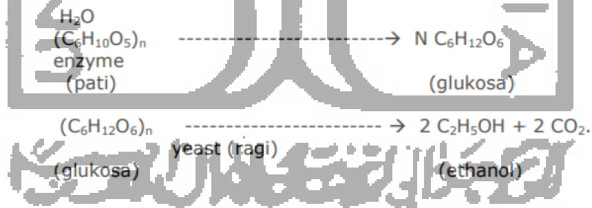
Gambar 2.3 Reaksi pembentukan Etanol

Produksi etanol (alkohol) dengan bahan baku tanaman yang mengandung pati atau karbohidrat, dilakukan melalui proses konversi karbohidrat menjadi gula (glukosa) larut air. Glukosa dapat dibuat dari pati-patian, proses pembuatannya dapat dibedakan berdasarkan zat pembantu yang dipergunakan, yaitu Hidrolisis asam dan Hidrolisis enzim. Menurut Nurdastuti, (2005) dalam proses konversi karbohidrat menjadi gula (glukosa) larut air dilakukan dengan penambahan air dan enzim, kemudian dilakukan proses peragian atau fermentasi gula menjadi etanol dengan menambahkan yeast atau ragi. Reaksi yang terjadi pada proses produksi etanol secara sederhana ditunjukkan pada Gambar 2.3 berikut ini: