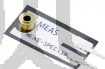
Gambar 2. 2 Meas Piezo Vibration Sensor

Sensor Piezo merupakan sensor yang sering digunakan untuk melakukan pengukuran fleksibel, sentuh, getaran dan guncangan. Sebuah resistor sederhana harus menurunkan tegangan ke level ADC.