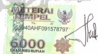
Dika Puji Resphaty