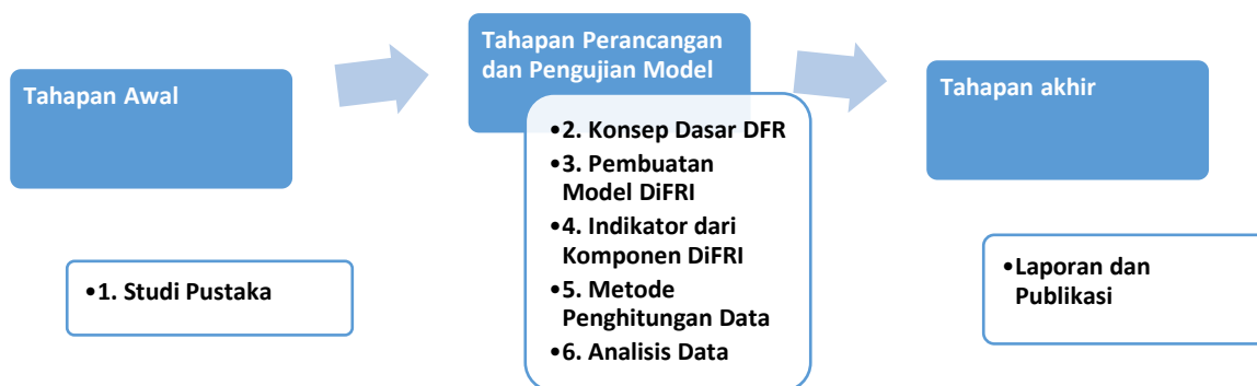
Gambar 3.1 Bagan Proses Metodologi Penelitian

Bab ini menjelaskan metode-metode yang dilakukan sehingga diketahui dengan jelas dan rinci tentang urutan langkah-langkah yang dibuat secara sistematis dan dapat dijadikan pedoman yang jelas dalam menyelesaikan penelitian ini, membuat analisis terhadap hasil penelitian, serta kesulitan-kesulitan yang dihadapi. Langkah-langkah tersebut dapat dilihat pada Gambar 3.1