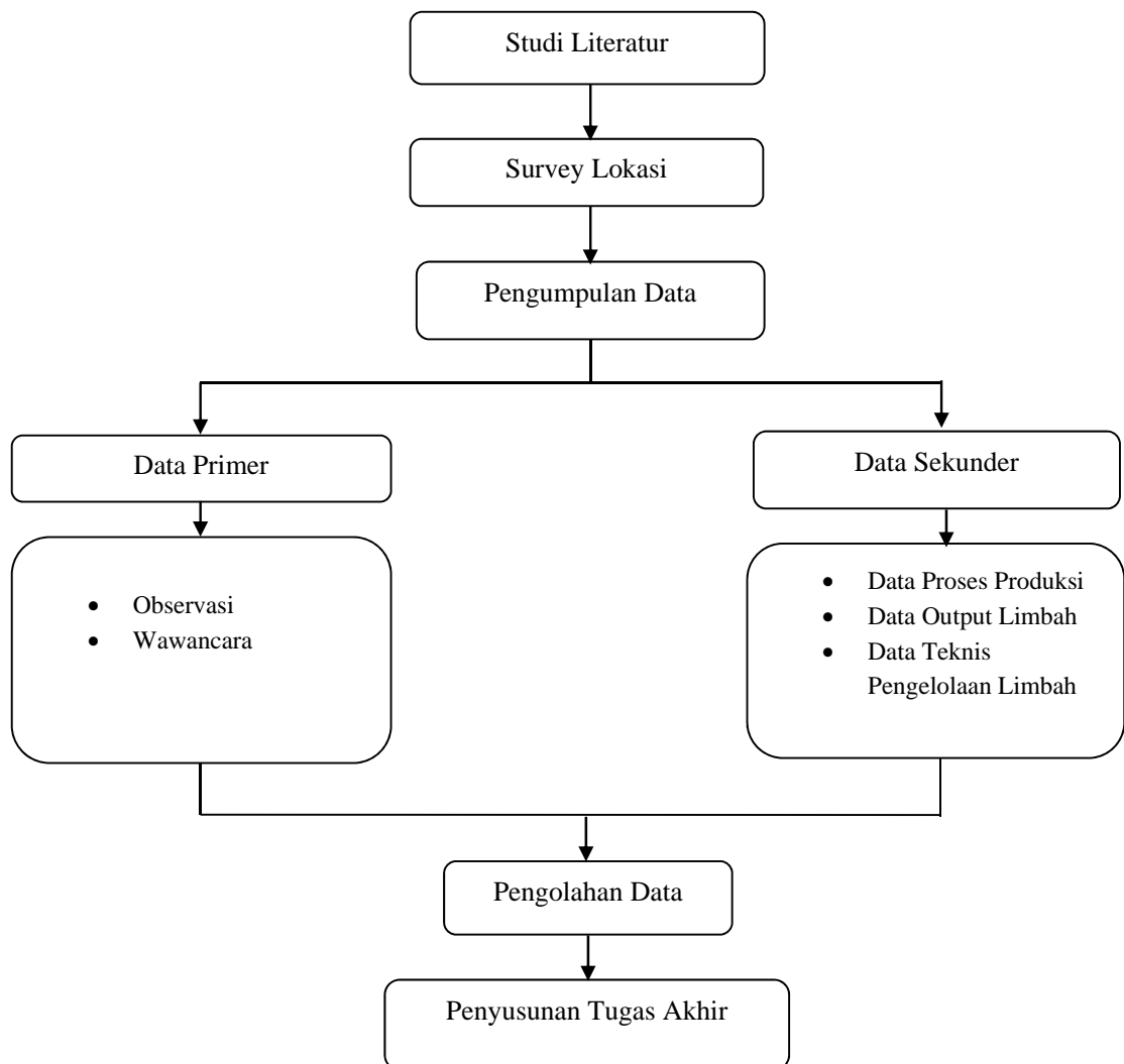
Gambar 3.1 Diagram Alir Penelitian

Dalam pelaksanaan penelitian ini diperlukan alur penelitian, berikut ini merupakan diagram alir penelitian sebagaimana dapat dilihat pada Gambar 3.1 di bawah ini: