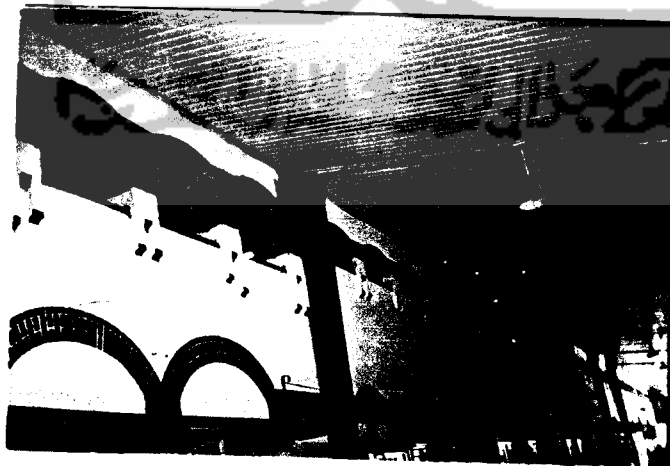
Gb 5 Elemen di Sepanjang Dinding Bangunan