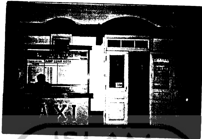
Gb.3 Fasilitas Pendukung Yang Kurang Mendapat Tempat