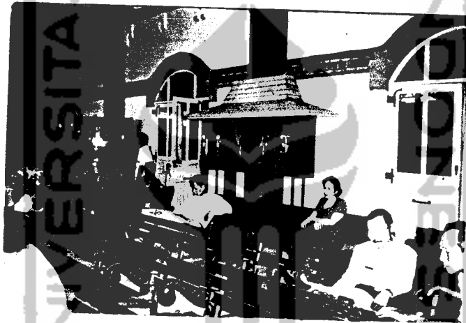
Gb.4 Penempatan Sarana Komunikasi Yang Kurang Baik