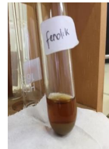
Uji Fenolik (-)