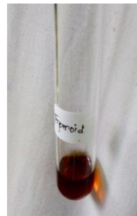
Uji Terpenoid (-)