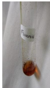
Uji Flavonoid (+)