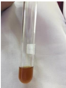
Uji Alkaloid (-)