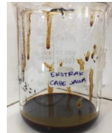
Ekstrak Buah Cabai Jawa