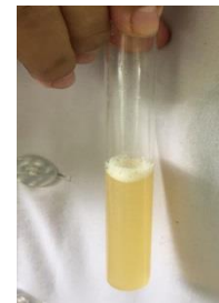
Uji Saponin (+)