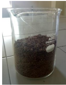
Serbuk Buah Cabai Jawa