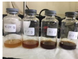
Variasi Sediaan Nanopartikel Ekstrak Buah Cabai Jawa