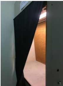
Laminar Air Flow