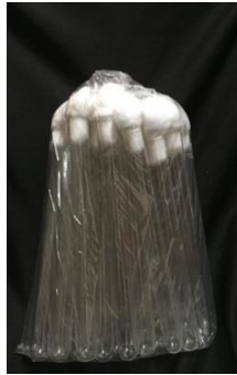
Tabung reaksi steril