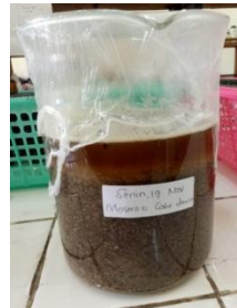
Maserasi Buah Cabe Jawa