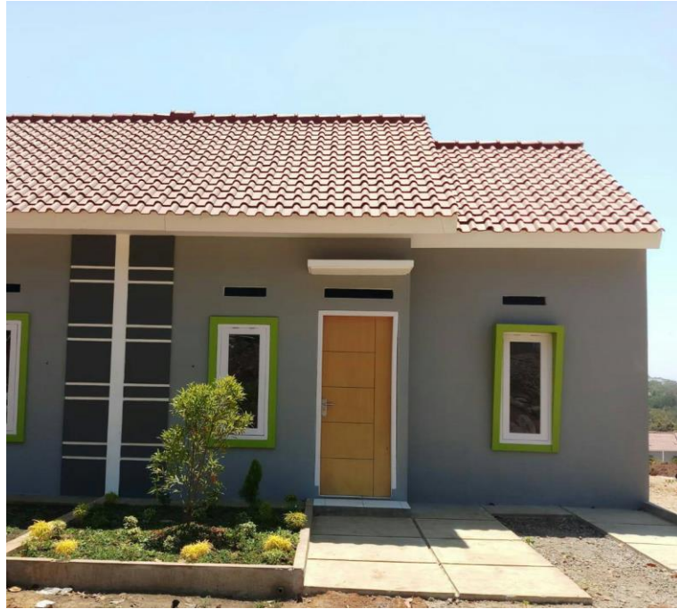
Tampak Depan Rumah Subsidi Tipe 27 Argo Residence