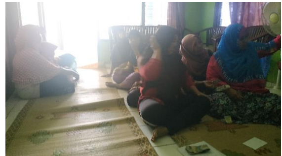
Kegiatan Pelatihan Wajib Kelompok