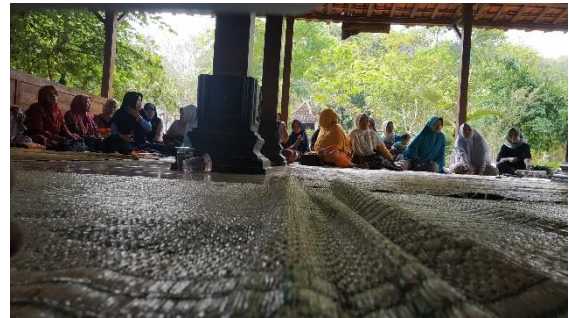
Kegiatan Halaqoh Mingguan