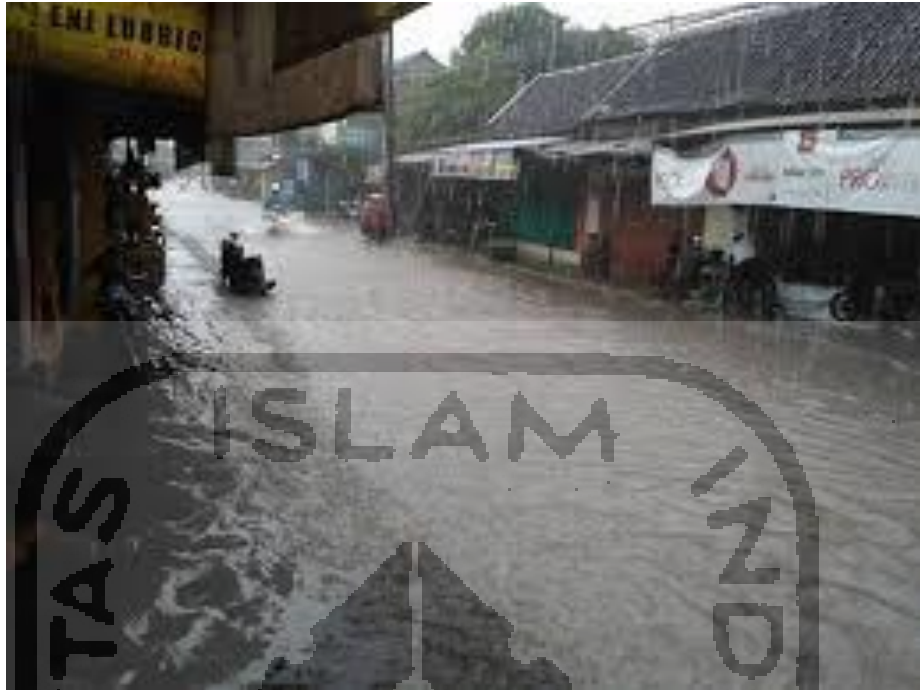
Gambar L-1.1 Genangan Yang Terjadi Ketika Hujan