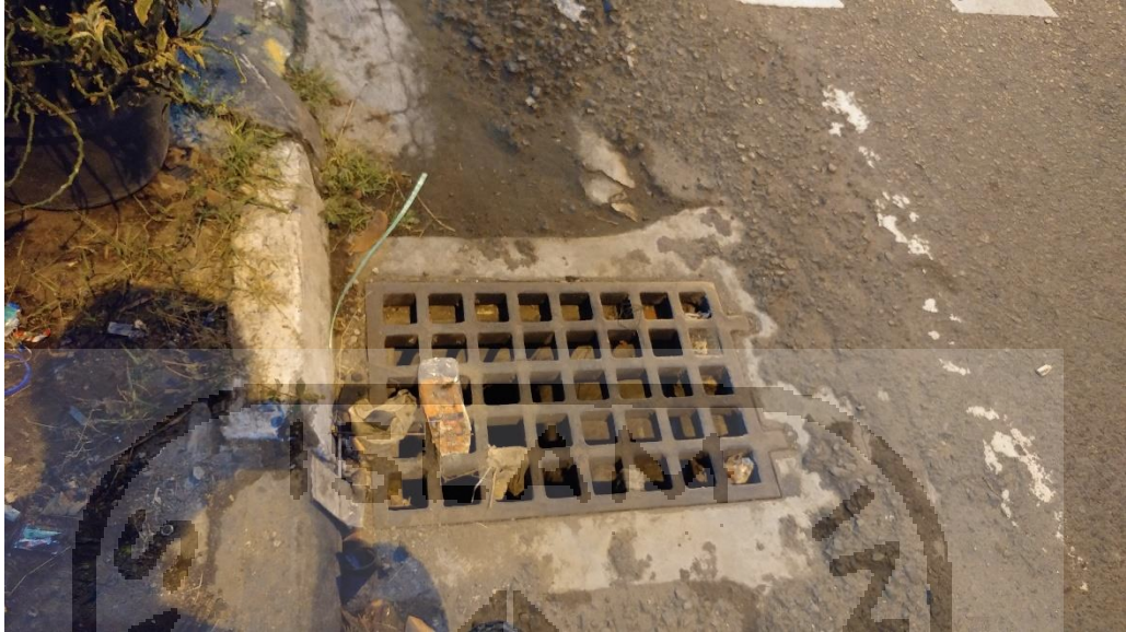
Gambar L-1.3 Drainase Saluran 2