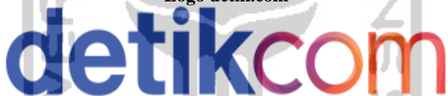
Gambar 2. 3 Logo detik.com