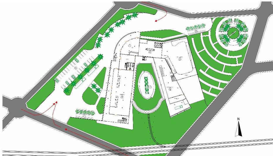
Gambar 6.2 Desain Baru Sirkulasi Masuk Kendaraan