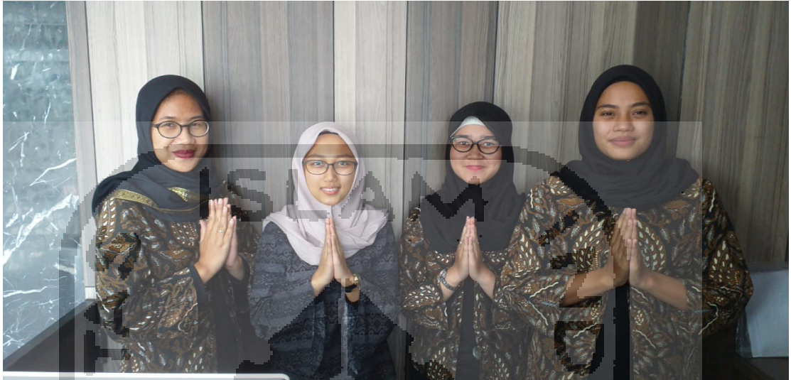
Lampiran 5: Seragam staff Front Office .