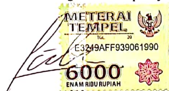
Muhammad Fikri Tulus