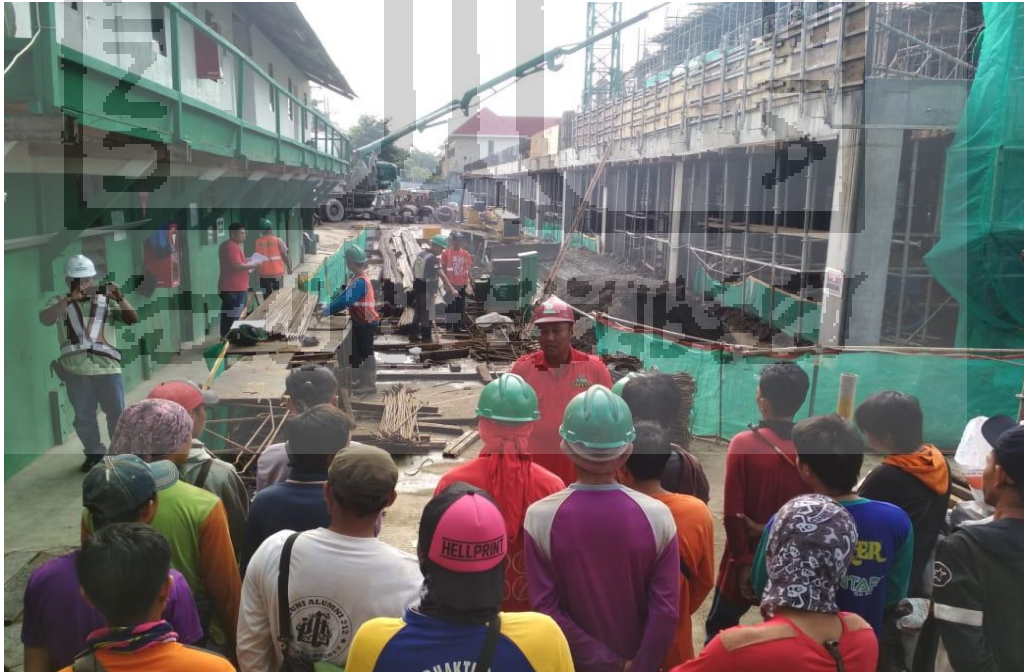
Gambar L-1.4 Safety Induction Setiap ada Pekerja Baru