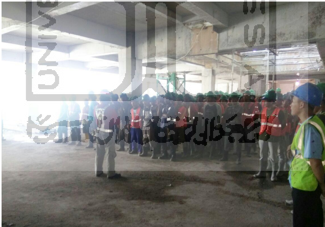
Gambar L-1.6 Safety Talk Setiap Hari Sabtu Pagi