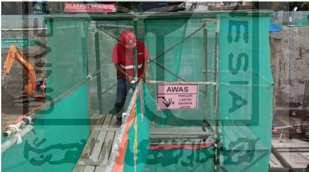
Gambar L-1.11 Rambu-Rambu Zona Bahaya