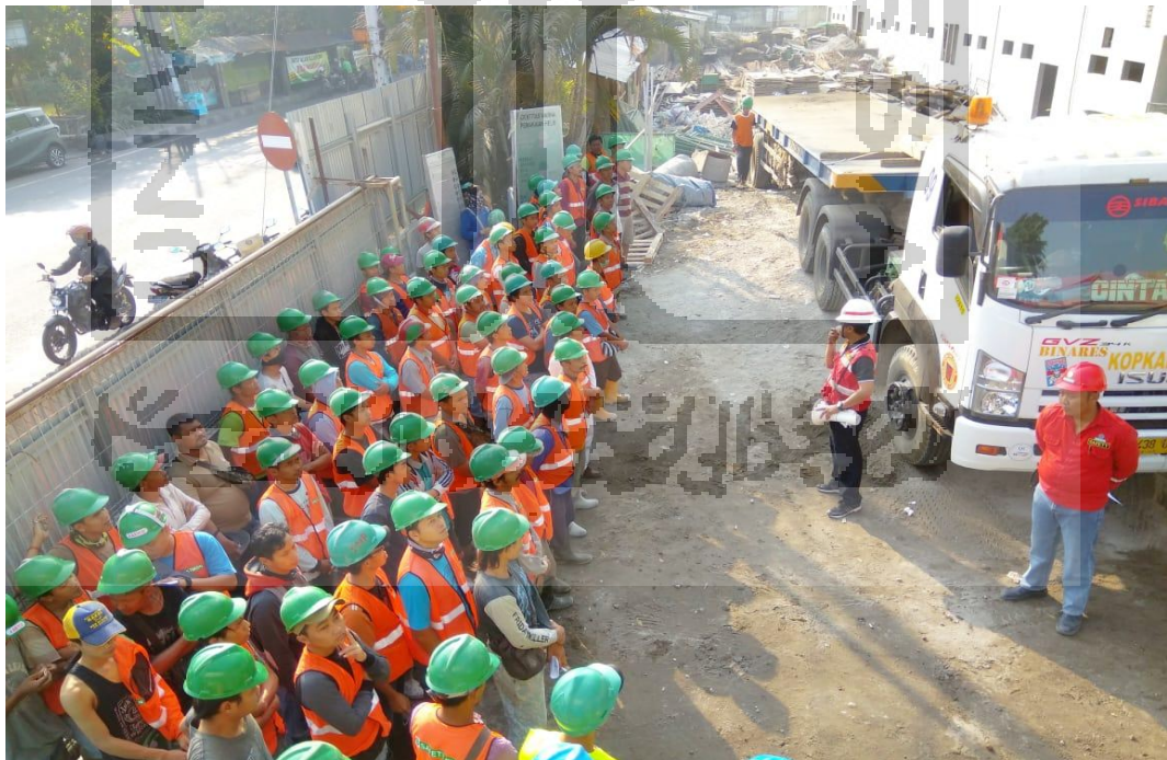
Gambar L-1.2 Para Pekerja Memakai APD Lengkap