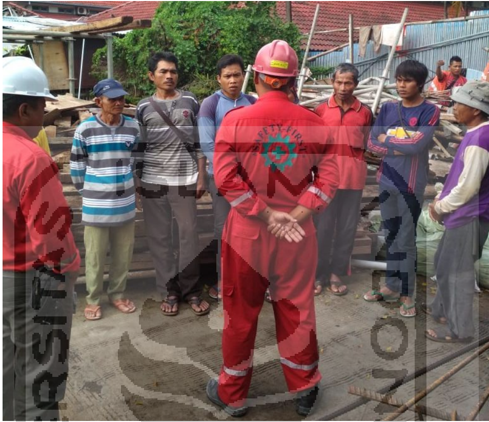
Gambar L-1.3 Safety Induction Setiap ada Pekerja Baru