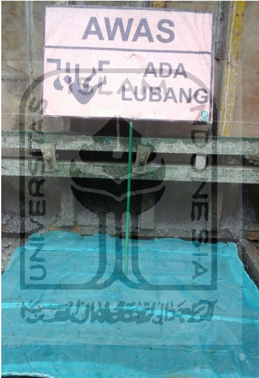
Gambar L-1.9 Rambu-Rambu Lubang