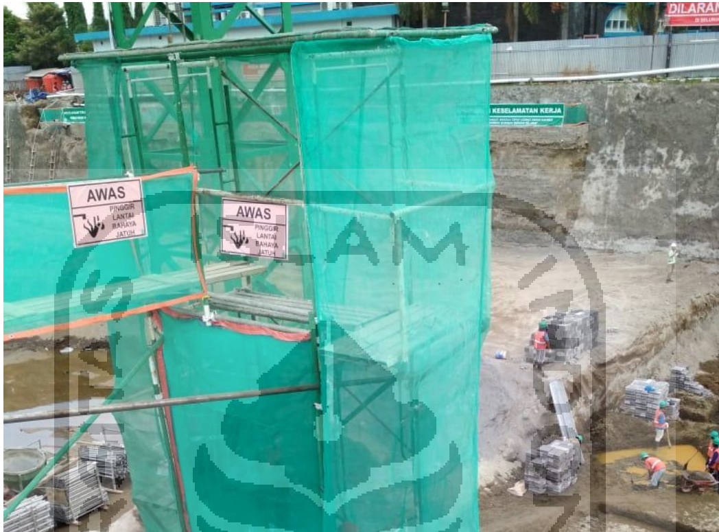
Gambar L-1.7 Rambu-Rambu Pembatas