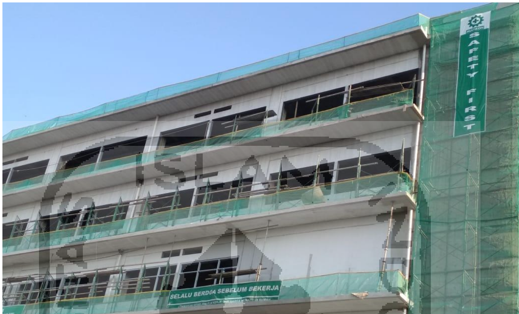
Gambar L-1.10 Rambu-Rambu Safety First