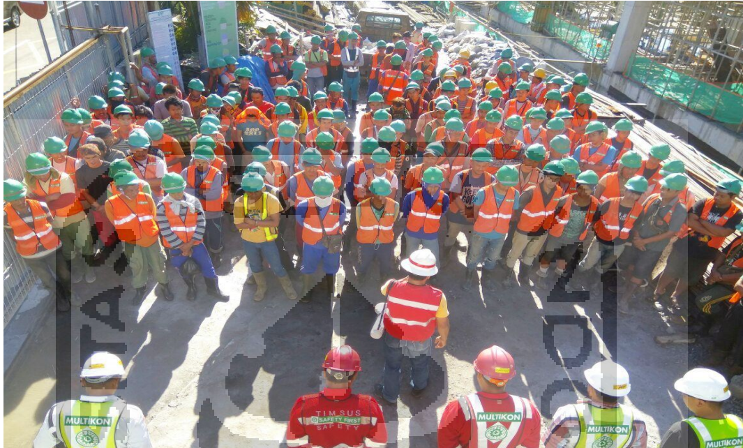
Gambar L-1.1 Para Pekerja Memakai APD Lengkap