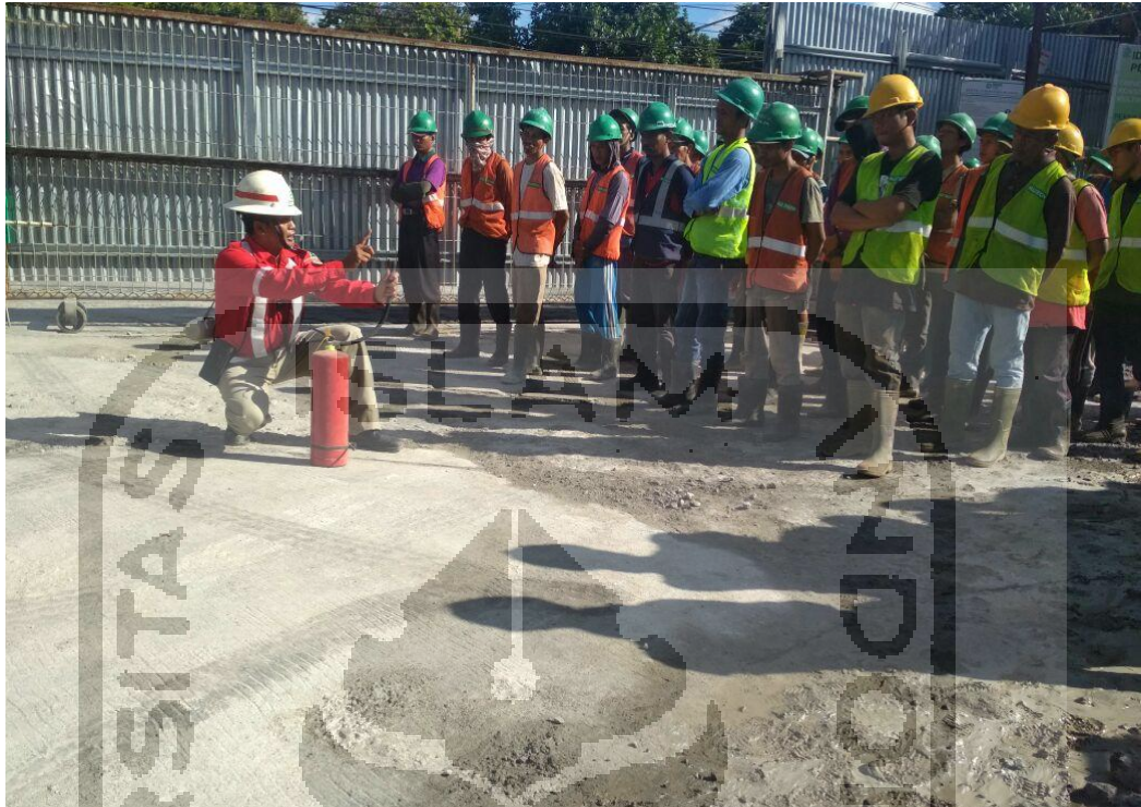
Gambar L-1.5 Pelatihan Penggunaan Alat Pemadam Kebakaran