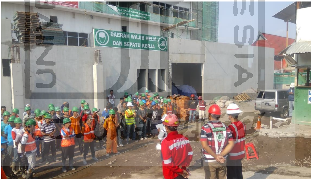
Gambar L-1.8 Rambu-Rambu Wajib Menggunakan APD