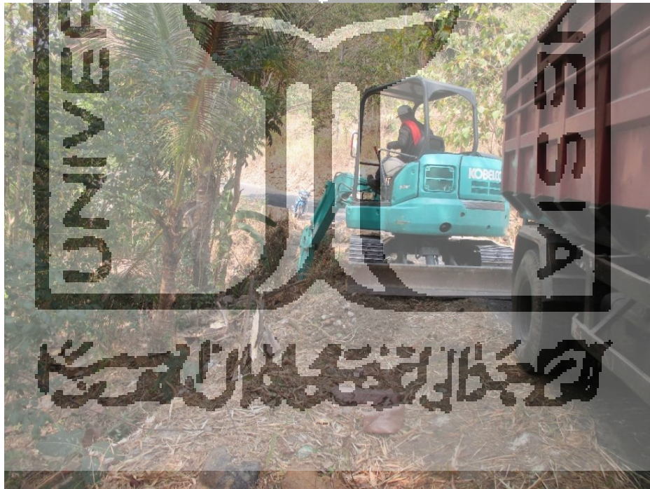
Lampira 15 Foto keadaan lokasi proyek