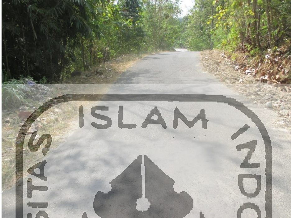
Lampira 14 Foto keadaan lokasi proyek