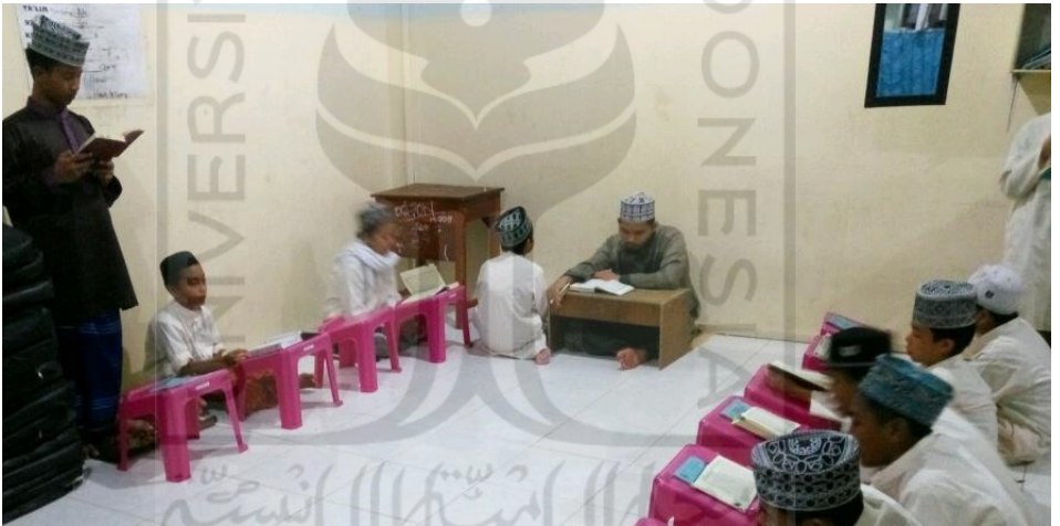
Gambar 15 Setoran Hafalan Al Quran