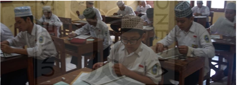
Gambar 13 Pembelajaran di Kelas