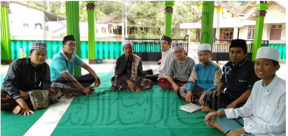
Gambar 19 Kegiatan Iktikaf Siswa