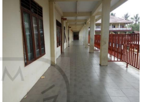
Gambar 1 Foto halaman depan SMPIT ADA Secang