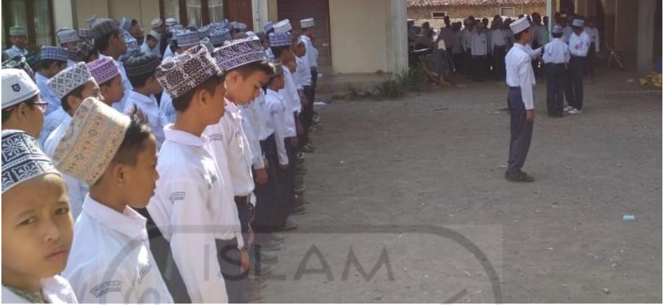
Gambar 16 Upacara Bendera hari Senin