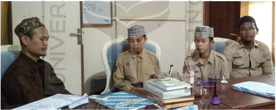
Gambar 13 Wawancara dengan beberapa Siswa SMPIT ADA