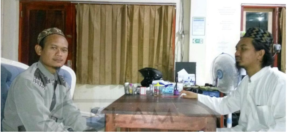
Gambar 12 Wawancara dengan Pengurus harian asrama, Ust. Abdul Ghofar