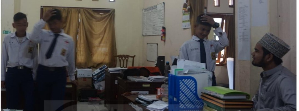
Gambar 14 Penanganan Kasus Siswa dengan pemanggilan ke kantor