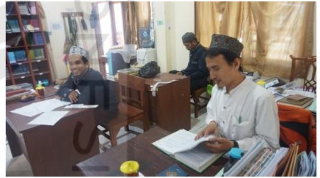
Gambar 2 Tampilan Gedung SMPIT ADA Secang dari sebelah Utara dan kantor Guru