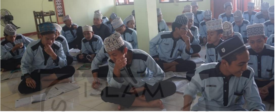
Gambar 14 Les Siswa Kelas 9 tahun ajaran 2018/2019