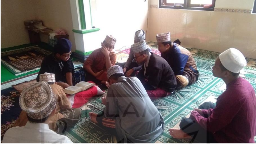
Gambar 20 Taklim fadhilah amal