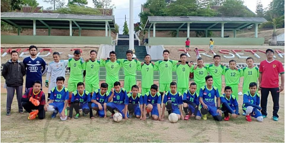
Gambar 18 Ektra Kurikulum Sepakbola