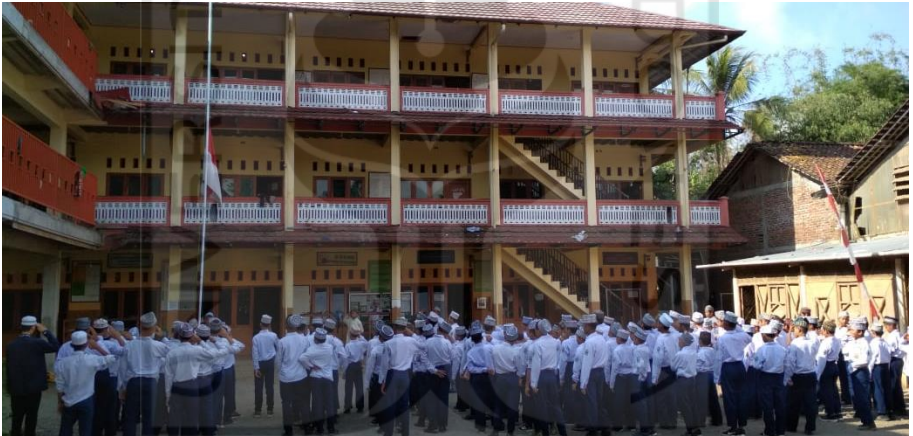
Gambar 17 Upacara Bendera hari Senin