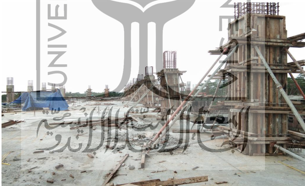
Gambar L 2.4 Kolom siap Cor