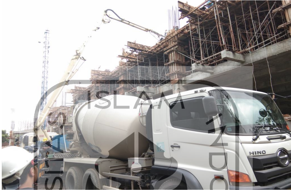
Gambar L 2.3 Truck dan Concrete Pump