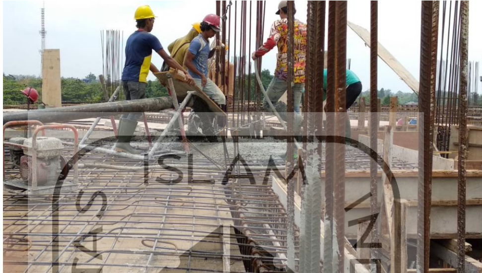
Gambar L 1.1 Pengecoran Plat dan Balok