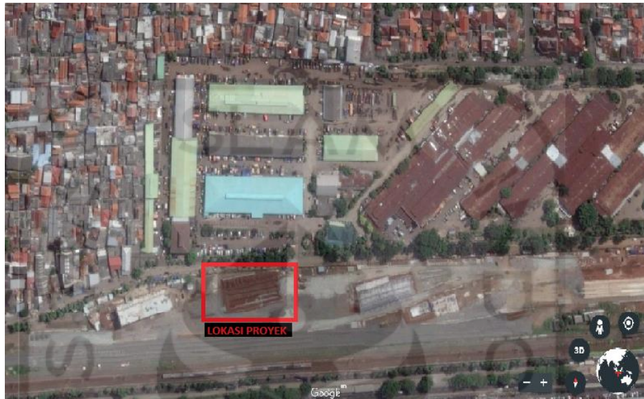
Gambar 4.1 Lokasi Proyek Ekspansi Gudang SRG PT. FOOD STATION TJIPINANG JAYA

Proyek Ekspansi Gudang SRG PT. FOOD STATION TJIPINANG JAYA ini berlokasi di JL. Pisangan Lama No.1 Jakarta Timur.