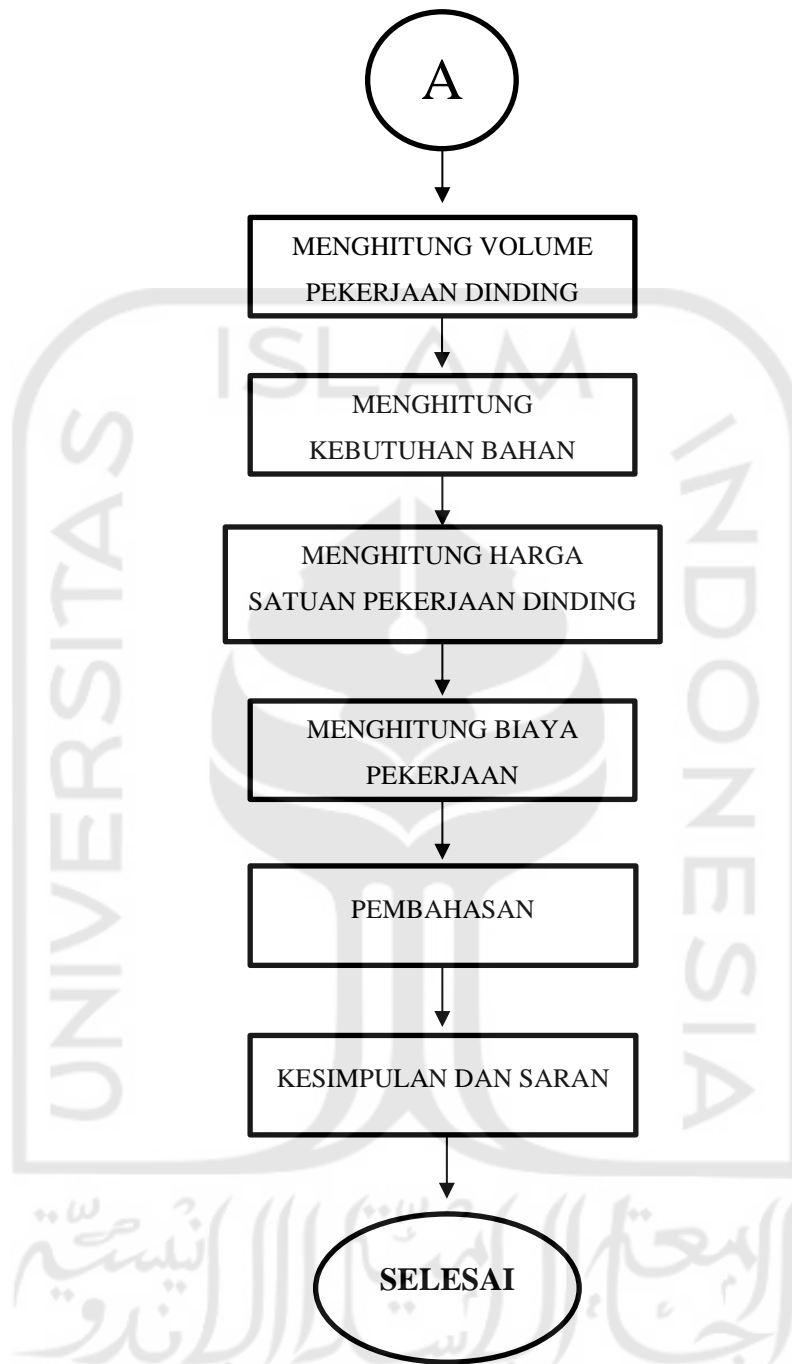
Gambar 4.1 Diagram Alir Penyusun Tugas Akhir ( Flow Chart )