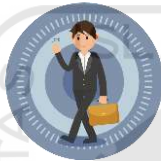
MANAJER PRODUKSI (ANDA)

Anda adalah Manajer Produksi yang baru dan fasilitator adalah CFO di perusahaan HappyMilk. Perusahaan ini menjual susu kemasan siap diminum.