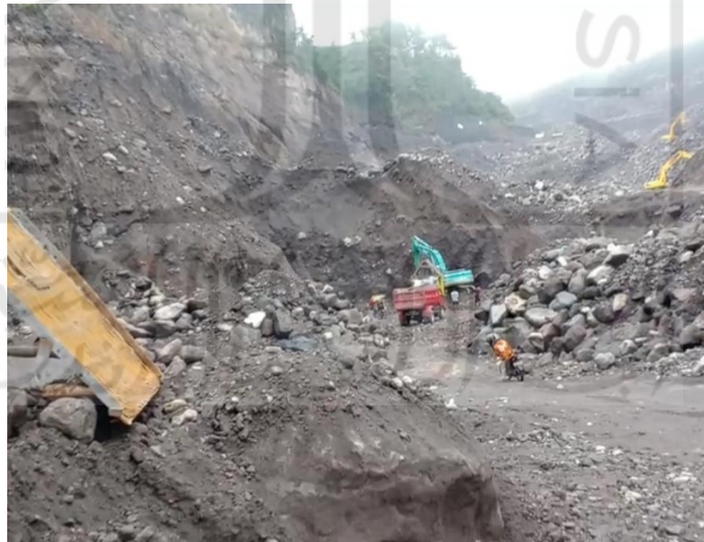
Gambar L-4.5 Kondisi Lapangan