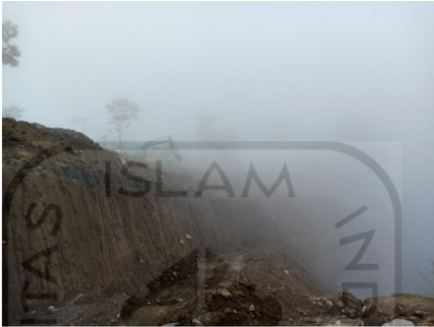
Gambar L-4.8 Jalur Masuk Tambang Berkabut