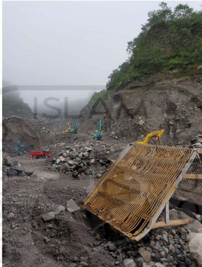
Gambar L-4.10 Saringan Pasir