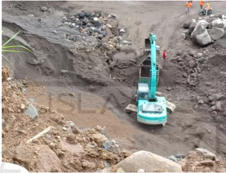
Gambar L-4.6 Pekerjaan Tambang