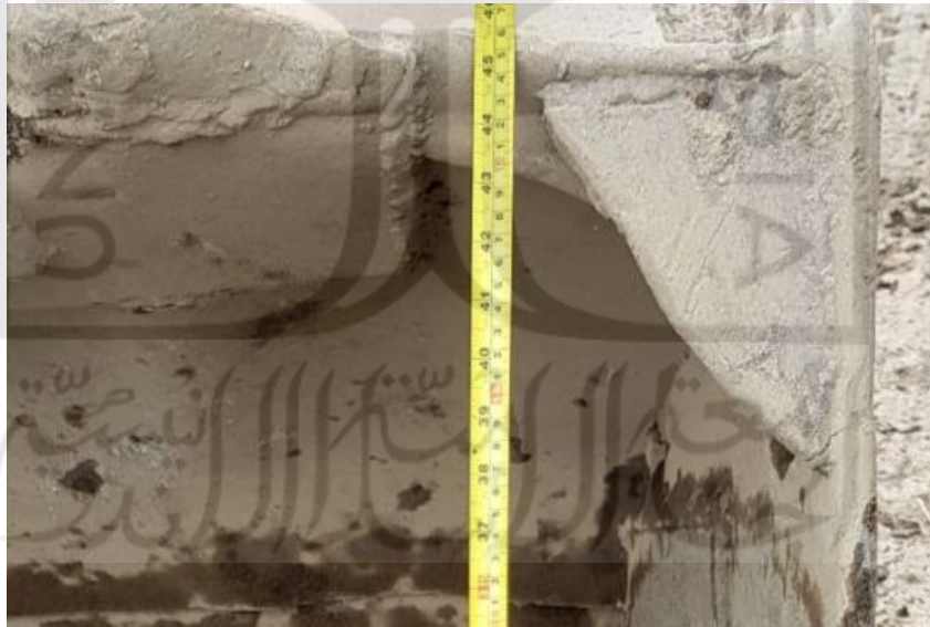
Gambar L-4.13 Bangun 1 9 inch atau 22,9 cm