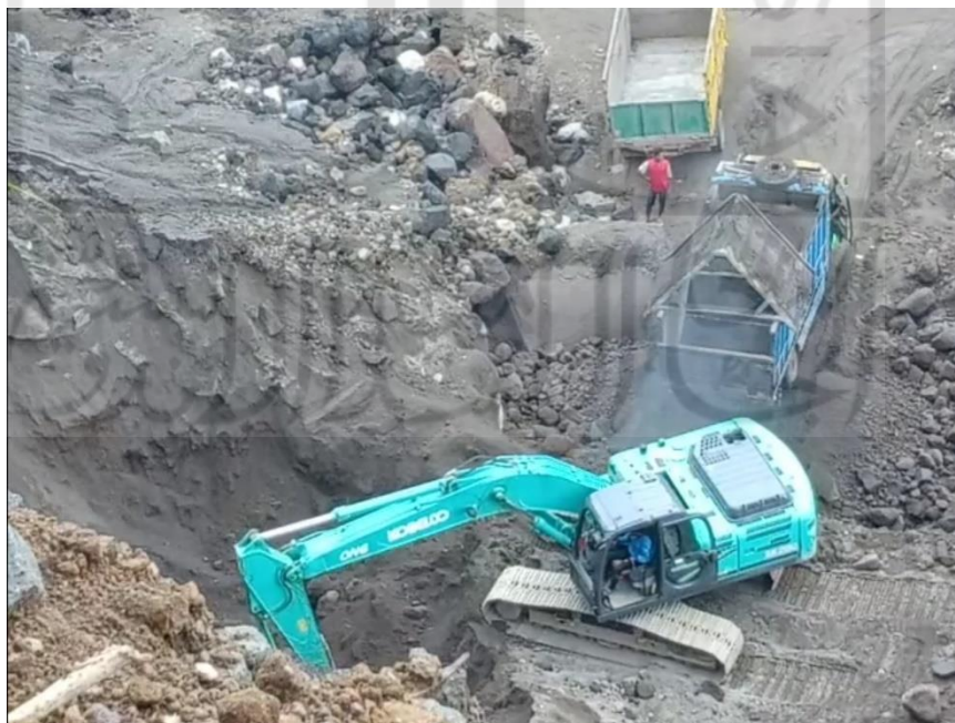
Gambar L-4.11 Kedalaman Gali