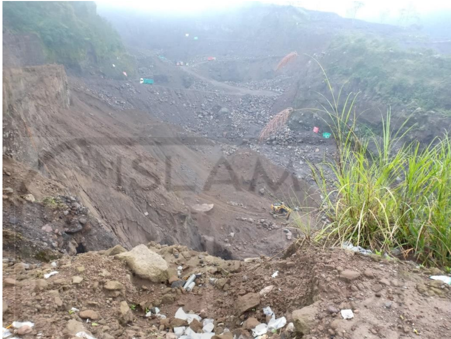
Gambar L-4.12 Kondisi Tempat Perekaman Longsor