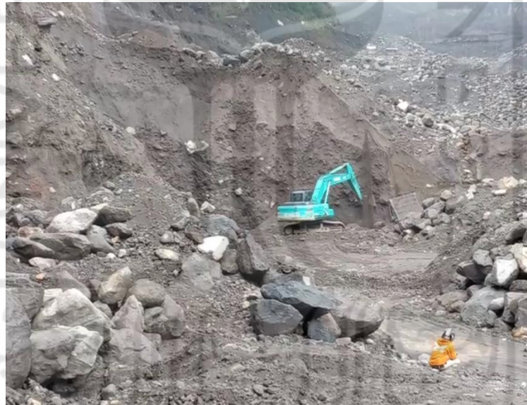
Gambar L-4.7 Kondisi Lapangan Tanpa Pembeli