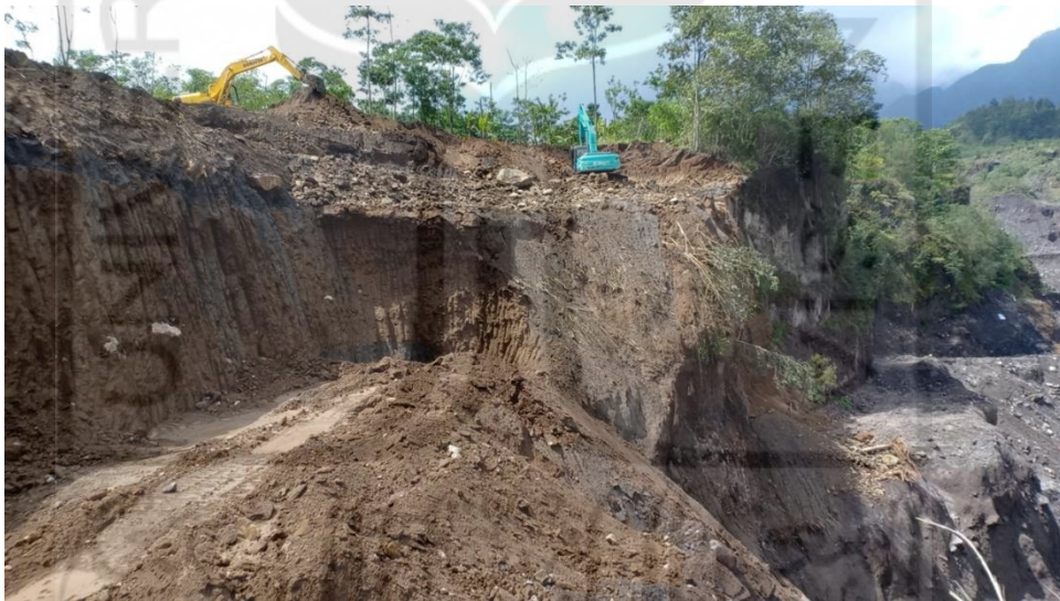
Gambar L-4.9 Jalur Masuk Longsor