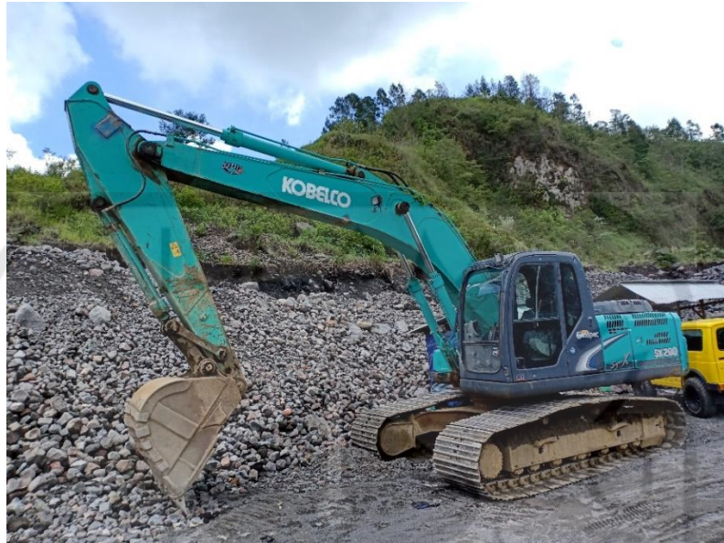
Gambar L-4.1 excavator Kobelco SK 200-8