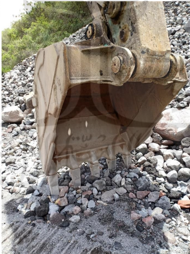
Gambar L-4.2 bucket Kobelco SK 200-8