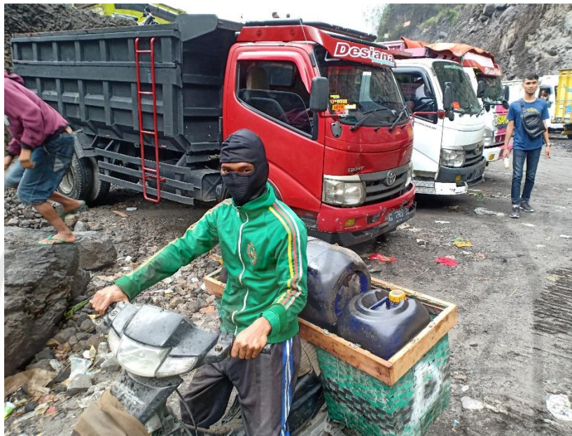
Gambar L-4.3 Solar