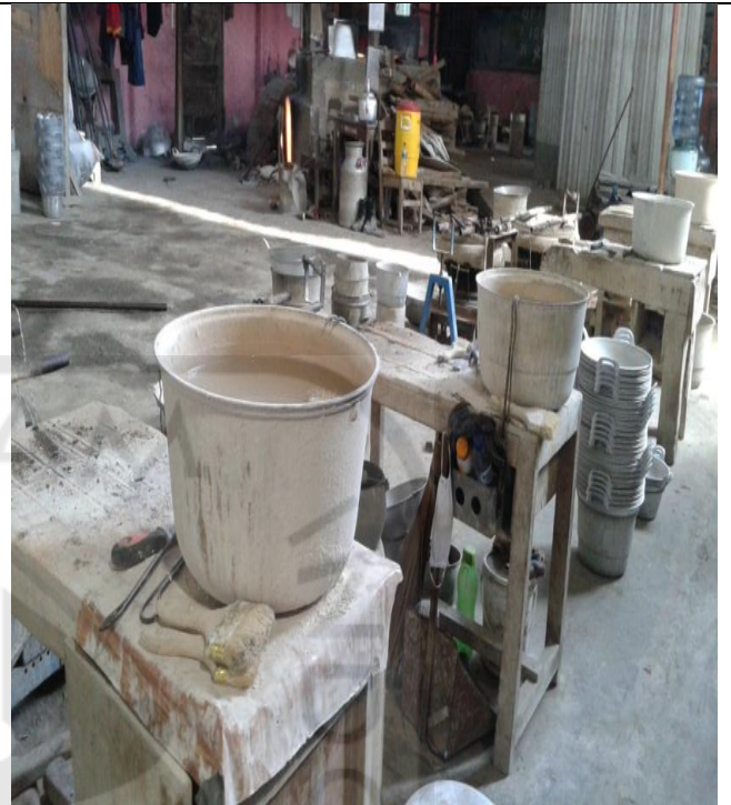
Kondisi Bagian Pemberian cairan pendingin pada hasil cetakan