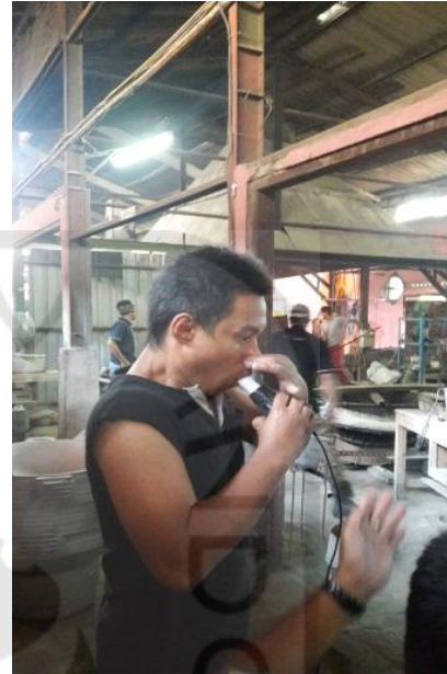
Kondisi Pengambilan Sampel fungsiparu di Produksi