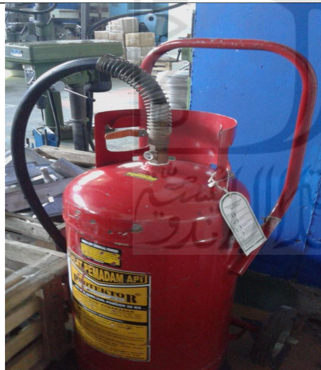
Kondisi APAR Besar di Ruang Produksi