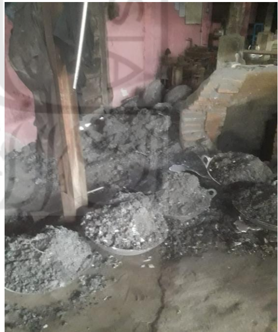
Kondisi Sampah Aluminium Oxid dari Furnace