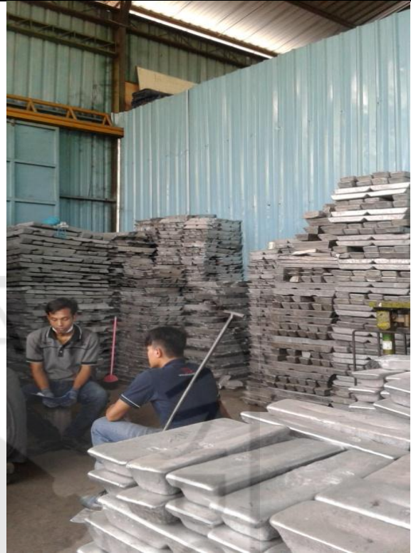
Kondisi Ruang Bahan Baku (Batang Aluminium)

UNIVERSITY OF INDONESIA الجامعة الإسلامية الاندونيسية