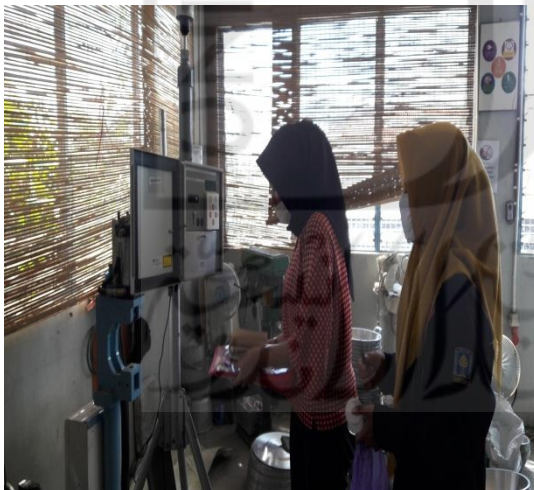
Kondisi Pengambilan Sampel Kadar Debu