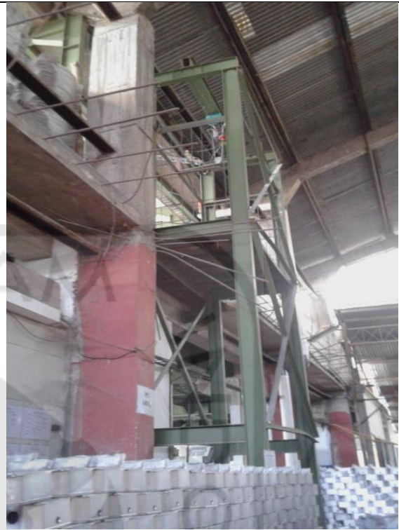
Kondisi Katrol untuk memindahkan Hasil cetakan ke ruang Pembubutan