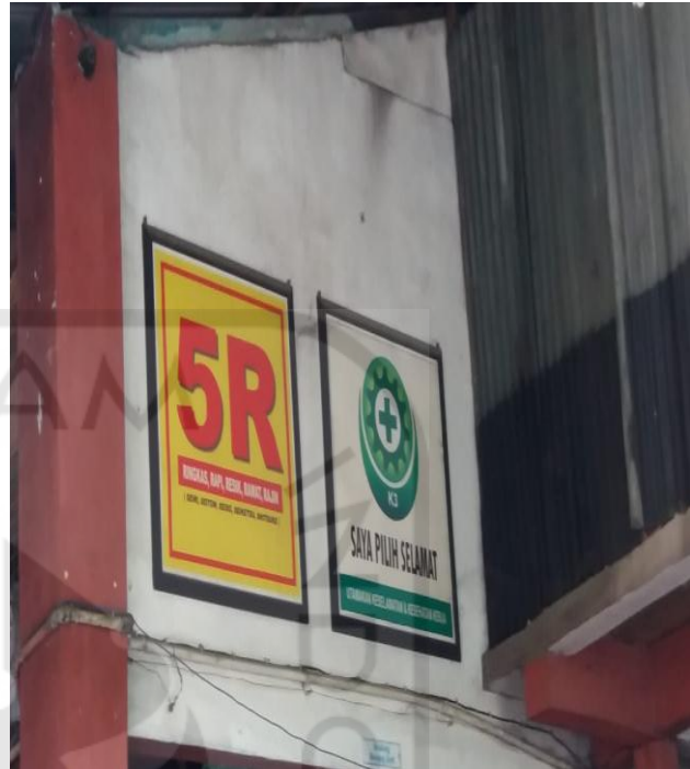
Kondisi Poster K3