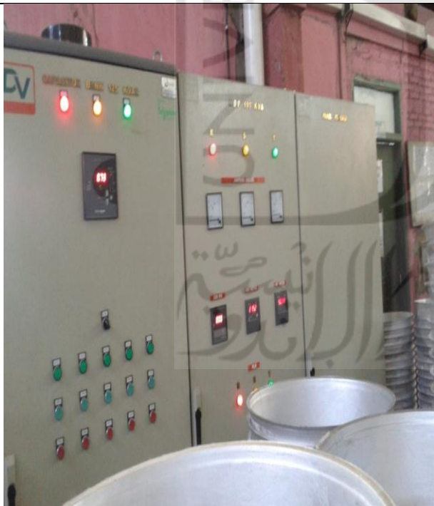
Kondisi Panel Utama di Ruang Produksi