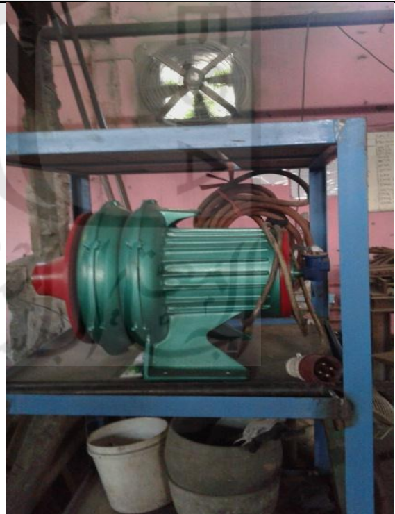
Kondisi Blower Cadangan