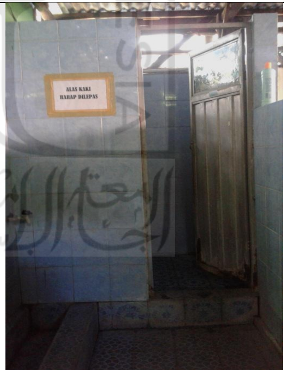
Kondisi Kamar mandi