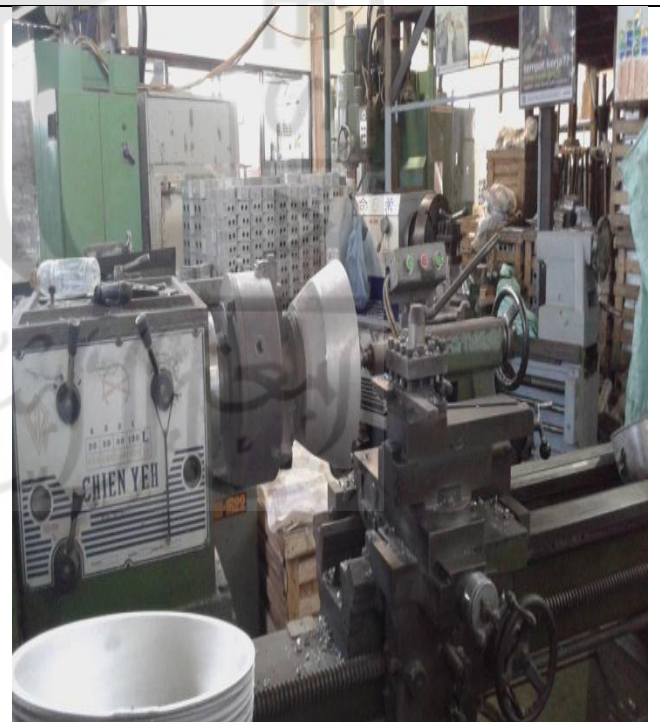
Kondisi Mesin Bubut