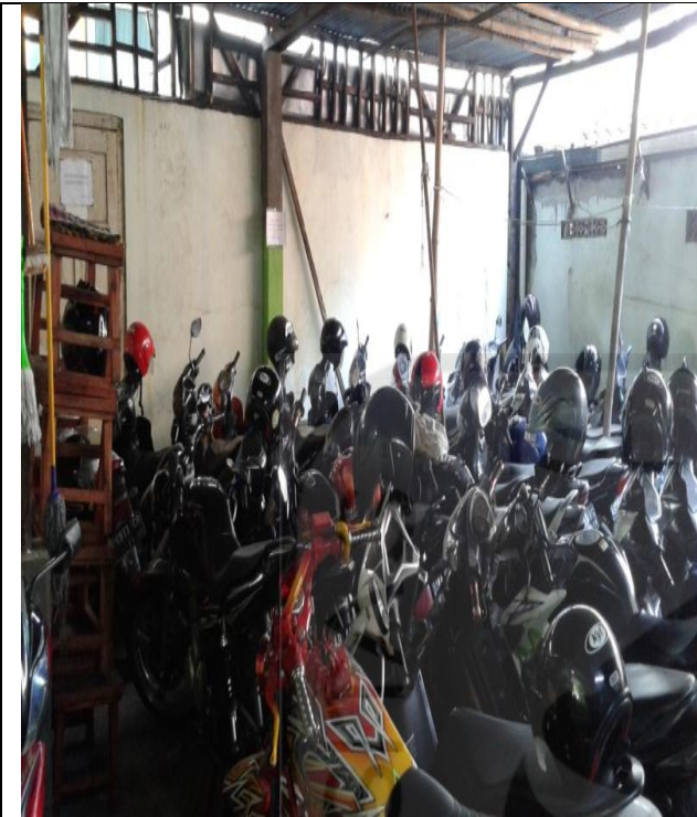
Kondisi Parkir sepeda motor