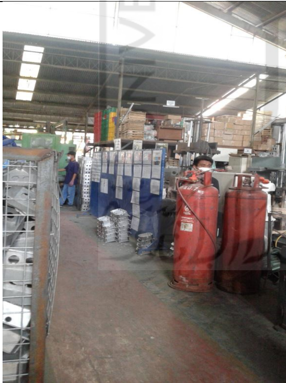
Kondisi LPG di ruang Produksi