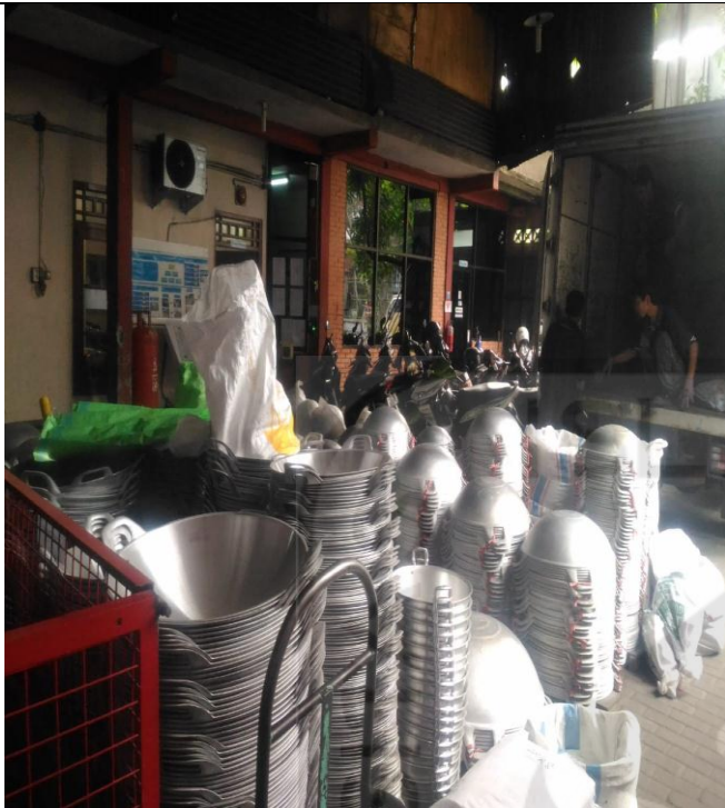
Kondisi Barang Jadi akan didistribusikan