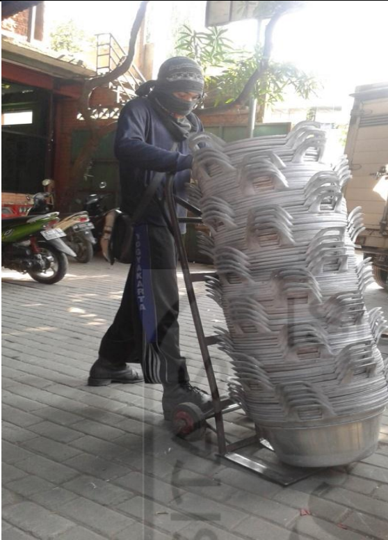
Kondisi Karyawan Mengangkat Barang Jadi Menggunakan Troli