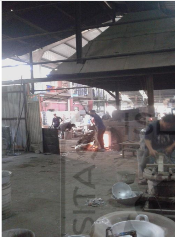
Kondisi Peleburan di Ruang Produksi