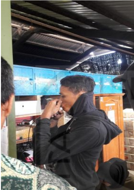
Kondisi Pengambilan Sampel fungsiparu di Fhinsing