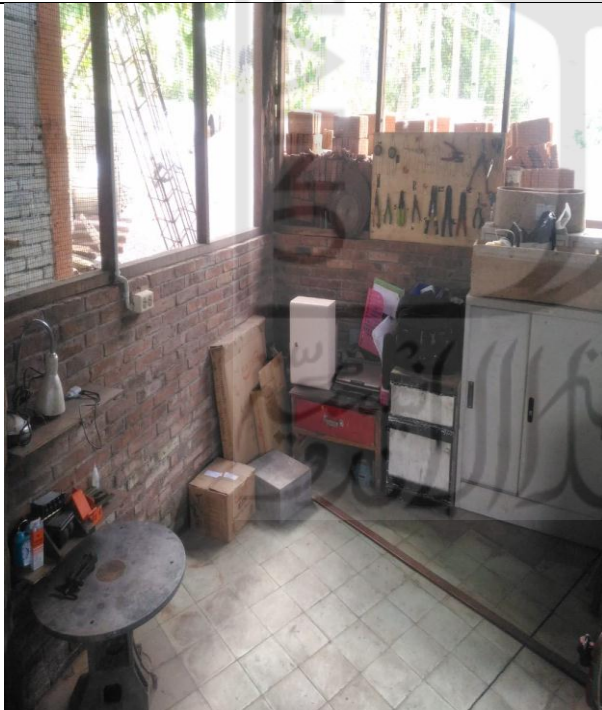
Kondisi Ruang Teknisi