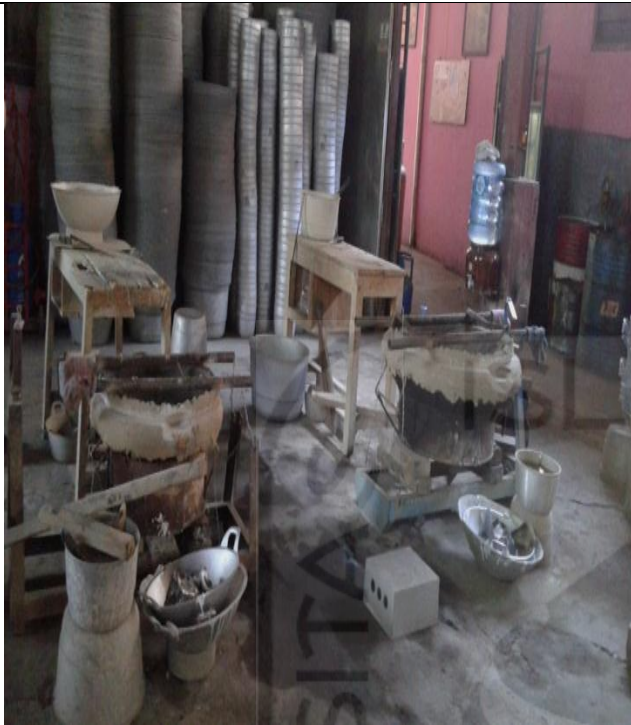
Kondisi Bagian cetakan