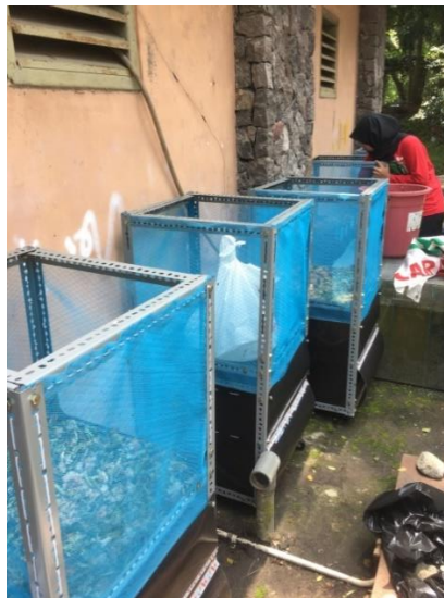
Gambar 3. 3 Proses pengomposan

adalah sampah organik sayur yang berasal dari pasar Pakem dan warung-warung sayur di daerah Pakem seperti yang telah disebutkan di ruang lingkup dan sampah sisa makanan dari Pondok Pesantren Sunan Pandanaran Komplek 3, RM. Padang Permato Bundo dan Warmindo Lodadi. Feedstok yang membutuhkan pencacahan, dicacah terlebih dahulu. Proses pengomposan dengan menggunakan reaktor aerob termodifikasi dilakukan di samping rumah kaca jurusan Teknik Lingkungan, Fakultas Teknik Sipil dan Perencanaan, Universitas Islam Indonesia.