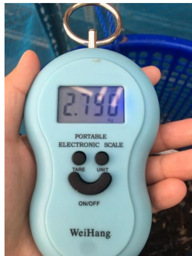
Gambar 3. 7 Pengukuran massa kompos

Pengukuran massa kompos dapat dilihat pada Gambar 3.7 sedangkan pengukuran massa maggot dengan neraca analitik dapat dilihat pada Gambar 3.8 berikut: