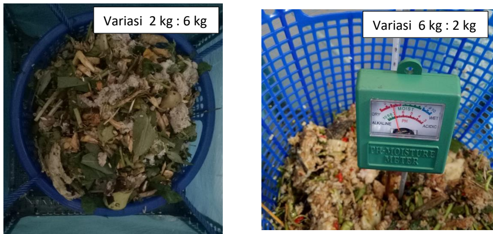
Gambar 3. 5 Variasi 2 kg : 6 kg dan variasi 6 kg : 2 kg pengomposan sampah sisa makanan : sampah sayur pada masing-masing reaktor yang digunakan