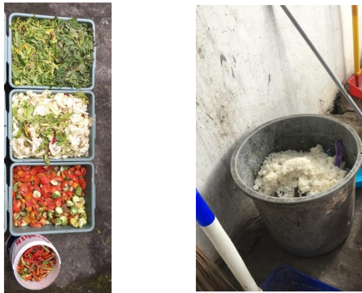
Gambar 3. 4 Feedstock sampah sayur dan sampah sisa makanan

Berikut merupakan gambar feedstock dan variasi pengomposan yang dilakukan: