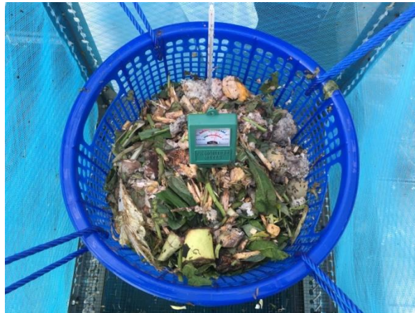
Gambar 3. 6 Pengujian parameter suhu dan pH pada reaktor setiap hari selama proses pengomposan

perlu dilakukan pengujian setiap hari, untuk mengontrol dan mengetahui hubungan antara pH dan suhu (Setyaningsih dkk., 2017).