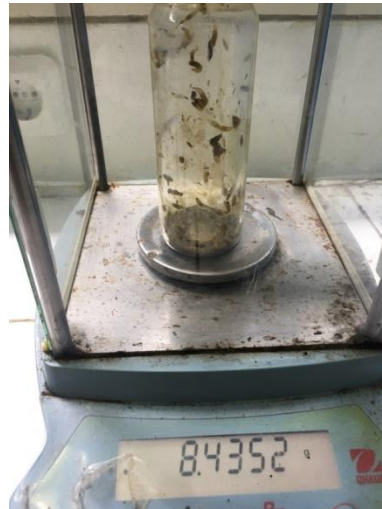
Gambar 3. 8 Pengukuran massa maggot

Selain itu dilakukan pengukuran kadar air secara berkala setiap seminggu sekali. Pengujian kadar air dilakukan supaya dapat diketahui kadar kelembabannya dan menjaga proses pengomposan tetap berada pada tingkat ideal. Pengujian kadar air dilakukan dengan menggunakan metode gravimetri berdasarkan Petunjuk Teknis Edisi 2 Analisis Kimia Tanah, Tanaman, Air dan Pupuk: Balai Penelitian Tanah 2009. Prinsip metode ini adalah dengan penguapan air pada bahan uji melalui proses pemanasan sehingga dapat dihitung berat konstan tersebut, yang kemudian selisih berat awal dan akhirnya merupakan kadar air pada bahan tersebut, seperti pada rumus berikut: