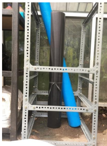
Gambar 3. 1 Kerangka awal reaktor

keranjang sampah yang dilubangi bagian bawahnya dan digantikan dengan jaring, sehingga maggot yang keluar dari samping keranjang sampah tetap tertampung di dalam reaktor. Reaktor dibuat 4 ruang dengan memberi sekat untuk membatasi per-ruangnya. Ruang paling atas digunakan sebagai tempat menggantung keranjang sampah untuk feedstock yang dikomposkan dengan massa sampah total 8 kg per reaktor. Ruang kedua dari atas merupakan ruang kosong karena digunakan untuk resirkulasi udara dengan volume 0,0125 \text{ m}^3 . Ruang ketiga untuk maggot dengan volume ruang 0,05 \text{ m}^3 dan ruang paling bawah digunakan untuk pupuk cair sebesar 0,0625 \text{ m}^3 . Berbeda dengan Ruang ke-satu dan dua yang sisinya ditutup dengan jaring, pada lapisan ke tiga dan ke empat bagian sisi ditutupi oleh fiber plat , hal ini supaya maggot tidak dapat keluar dan ember untuk kompos cair dapat dimasukkan ke dalam lapisan ke empat. Digunakan waring dengan lubang yang kecil untuk sisi-sisi lapisan atau ruang pertama dan kedua. Selain itu, waring ukuran tersebut juga digunakan untuk sisi bawah pada ruang ke-3 atau ruang penampung maggot. Sedangkan sisi bawah pada ruang pengomposan digunakan jaring yang lubangnya lebih besar sedikit dari waring yang berbahan kawat supaya dapat menahan beban sampah dengan kuat. Skema reaktor aerob termodifikasi tersebut dapat dilihat pada gambar di bawah ini :