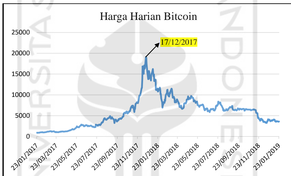
Gambar 5.1 Grafik Harga Harian Bitcoin dari 23 Januari 2017 s.d 23 Januari 2019

Sebelum melakukan analisis data menggunakan metode bayesian regularization neural network , terlebih dahulu peneliti melakukan analisis deskriptif terhadap data historis Bitcoin untuk mengetahui gambaran umum Bitcoin selama dua tahun terakhir yaitu dari 23 Januari 2017 s.d 23 Januari 2019.