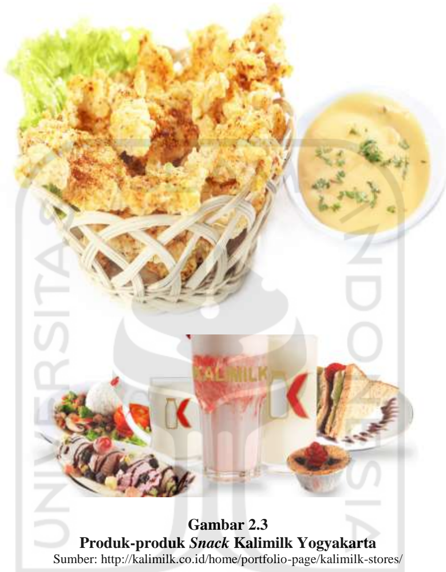
Gambar 2.3 Produk-produk Snack Kalimilk Yogyakarta