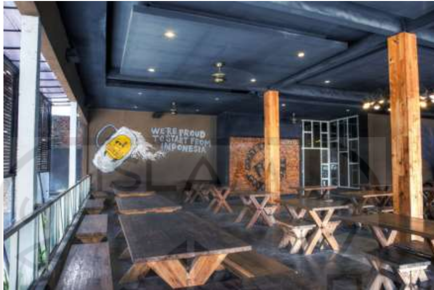
Gambar 2.1 Store Kalimilk Yogyakarta