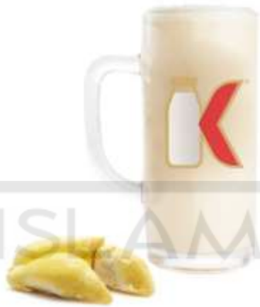
Gambar 2.2 Produk Susu Kalimilk Yogyakarta