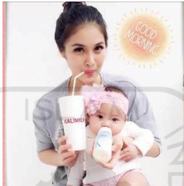
Gambar 2.4 Konsumen Dewasa dan Bayi Kalimilk Yogyakarta