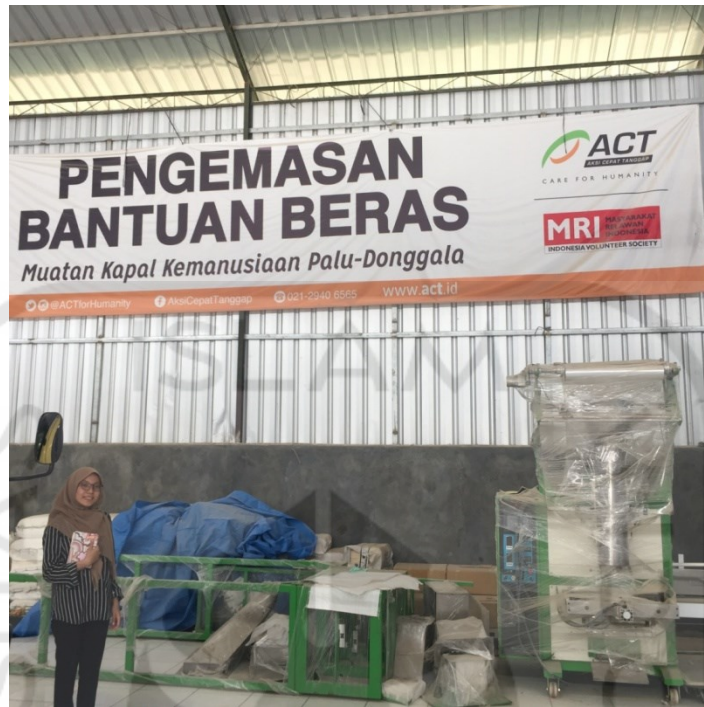
Foto bersama dengan Pimpinan Global Wakaf-ACT Yogyakarta