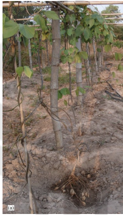
Gambar 2.1. Tanaman Kwao Krua ( Pueraria mirifica ) (Malaivijitnond, 2012).

Tanaman kwao krua memiliki bentuk akar berbonggol seperti umbi. Akarnya berbentuk bulat memiliki berbagai macam ukuran, memiliki berat 60-100 kg. Bunganya berwarna ungu kebiruan dengan panjang maksimal 30 cm, menghasilkan biji polong yang memiliki lebar 7 mm, panjang 3 cm, berwarna coklat, dan berisi hingga 3-5 biji (Malaivijitnond, 2012).