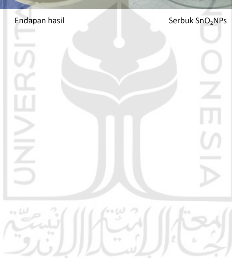
Serbuk SnO 2 NPs