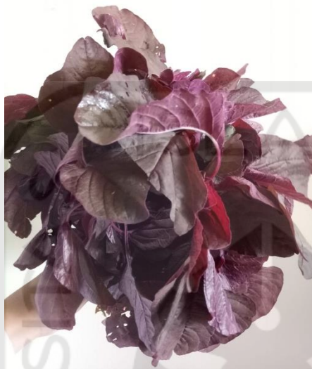
Daun bayam merah