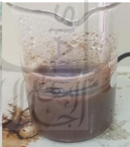
Pemanasan larutan SnCl 2 .2H 2 O dan ekstrak daun bayam merah