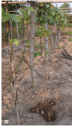
Gambar 2.1. Tanaman Kwao Krua ( Pueraria mirifica ) (Malaivijitnond, 2012).

Tanaman kwao krua memiliki bentuk akar berbonggol seperti umbi. Akarnya berbentuk bulat memiliki berbagai macam ukuran, memiliki berat 60-100 kg. Bunganya berwarna ungu kebiruan dengan panjang maksimal 30 cm, menghasilkan biji polong yang memiliki lebar 7 mm, panjang 3 cm, berwarna coklat, dan berisi hingga 3-5 biji (Malaivijitnond, 2012).