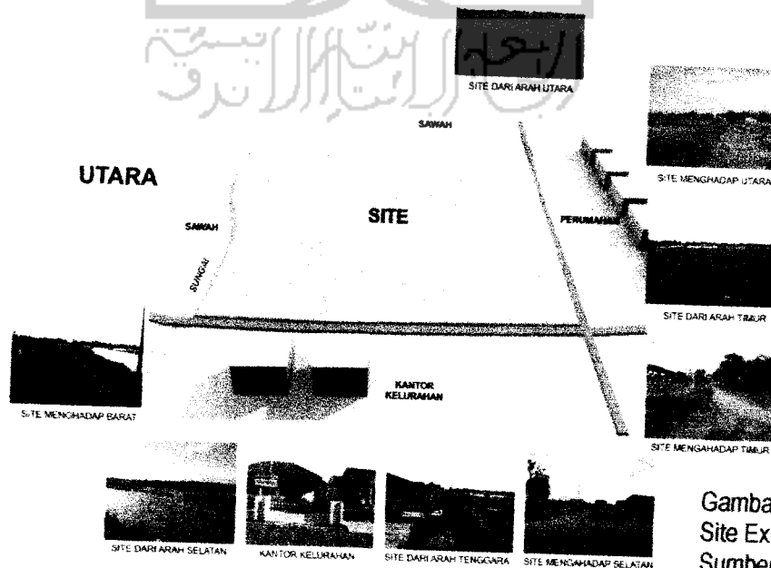
Gambar 1.4 Site Existing