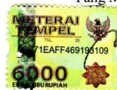
Niken Mangambar Arum