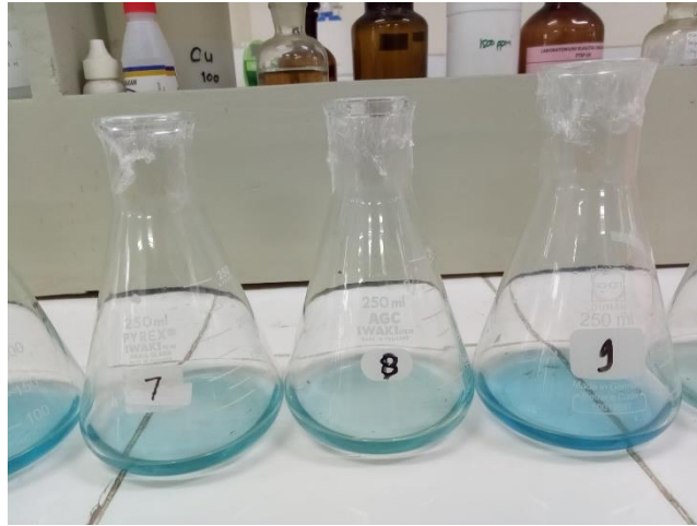
Dokumentasi Pengujian Amonia