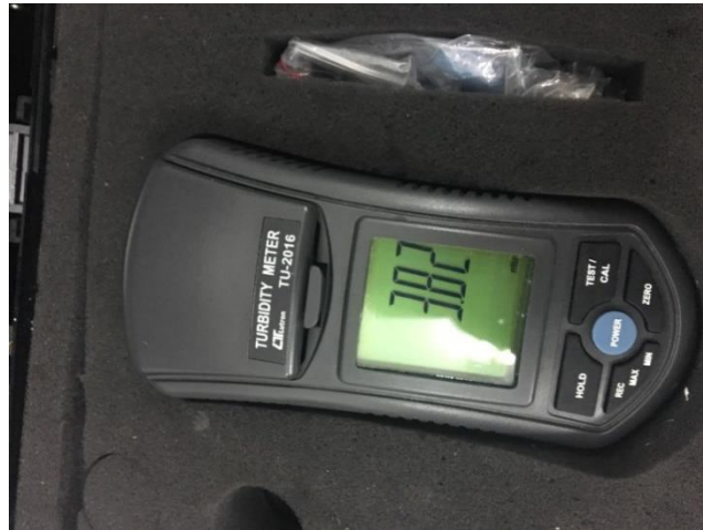
Dokumentasi Alat Turbiditi Meter