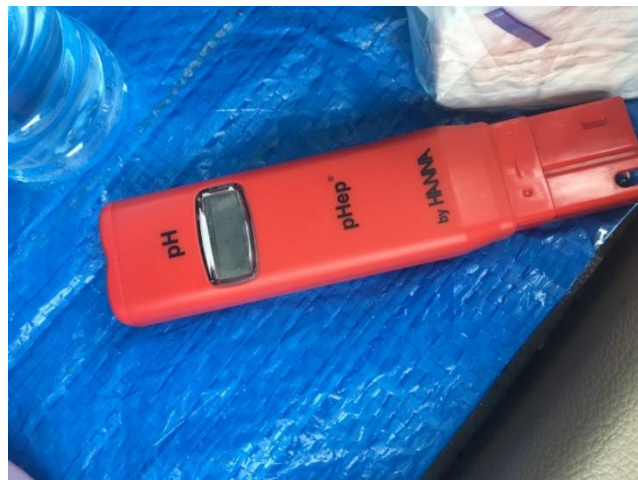
Dokumentasi Alat pH meter