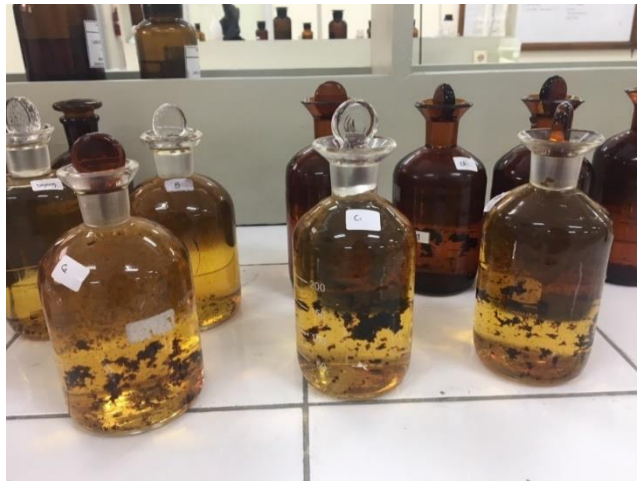
Dokumentasi Pengujian BOD