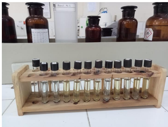
Dokumentasi Pengujian COD