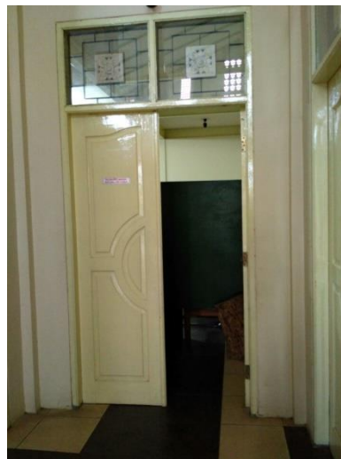
Gambar 3. 1 Ruang berita ( Newsroom ) TV9 Lombok

Newsroom merupakan sebuah ruang berita yang menjadi tempat reporter TV9 Lombok menghasilkan berita. Dalam satu ruangan terdapat kurang lebih tujuh unit komputer untuk bekerja. satu unit digunakan untuk menulis naskah berita, satu unit digunakan untuk menulis narasi berita yang dibacakan oleh presenter saat on air . Sebanyak empat unit komputer digunakan untuk proses editing video berita. Satu unit terakhir digunakan oleh wartawan atau reporter untuk melakukan perekaman suara atau Dubbing berita. Di dalam ruang ini juga terdapat ruang rapat redaksi dimana ruangan tersebut juga dijadikan sebagai ruang berita TV9 Lombok.