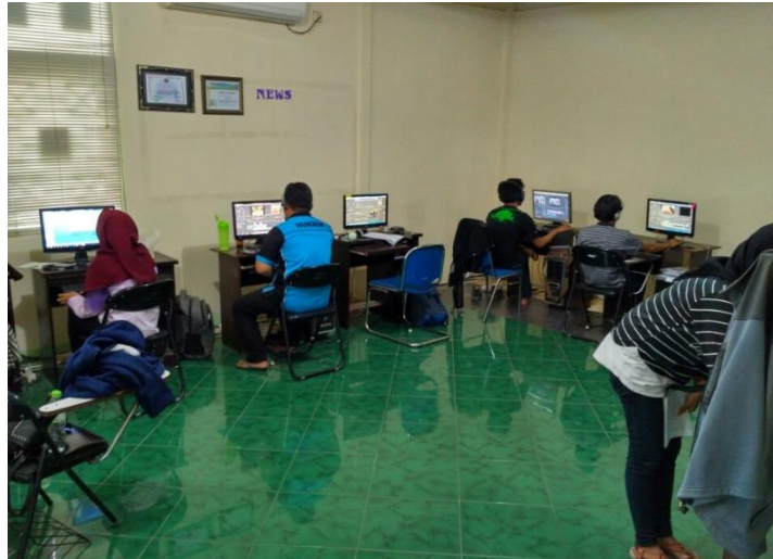
Gambar 3. 2 Keadaan di dalam Ruang Redaksi dan Ruang Rapat