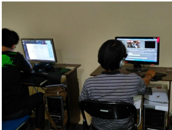
Gambar 3. 6 Proses editing berita