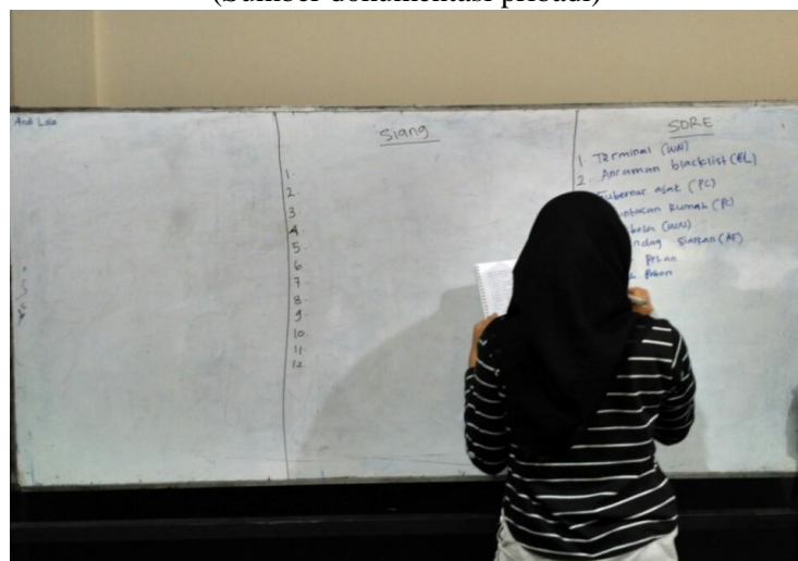
Gambar 3. 4 Penulisan Roundown (Sumber dokumentasi pribadi)