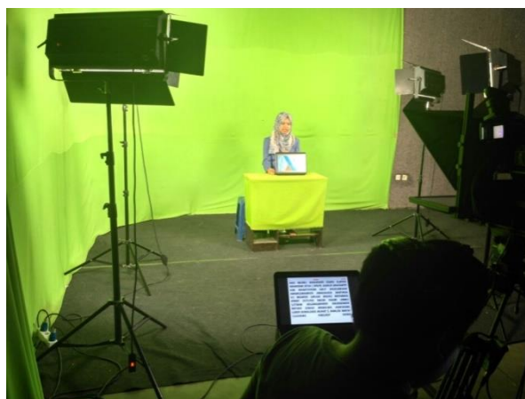
Gambar 3. 7 Proses Penayangan berita