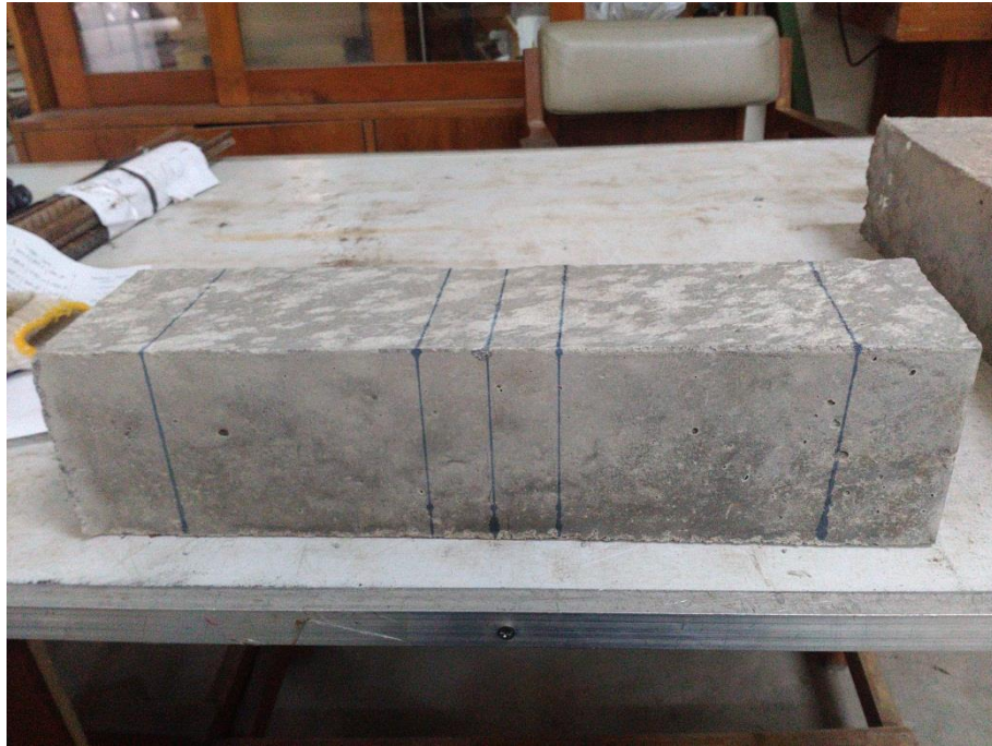
Gambar L-8.3 Pola Retakan Balok Beton BSR 1