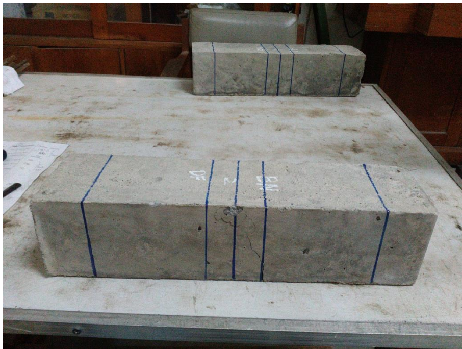
Gambar L-8.1 Pola Retakan Balok Beton BN