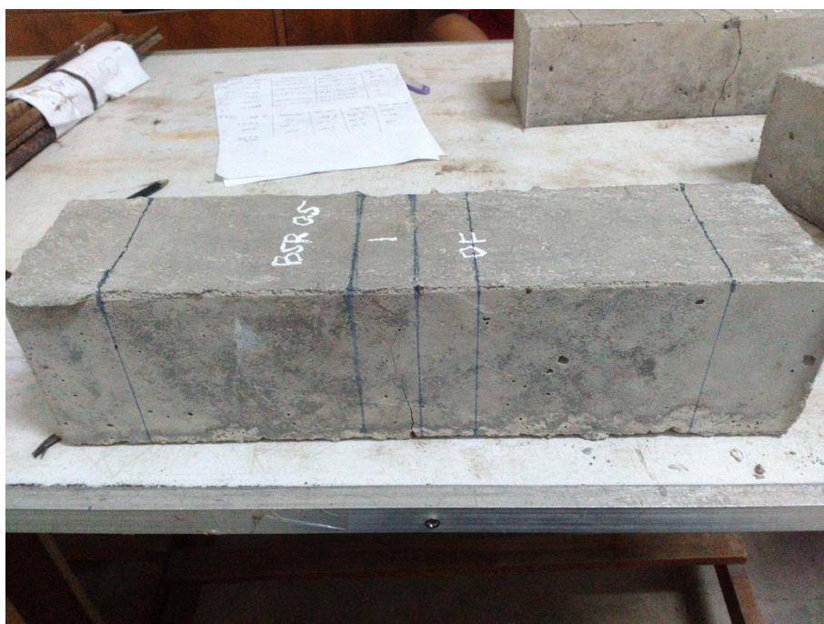
Gambar L-8.2 Pola Retakan Balok Beton BSR 0,5