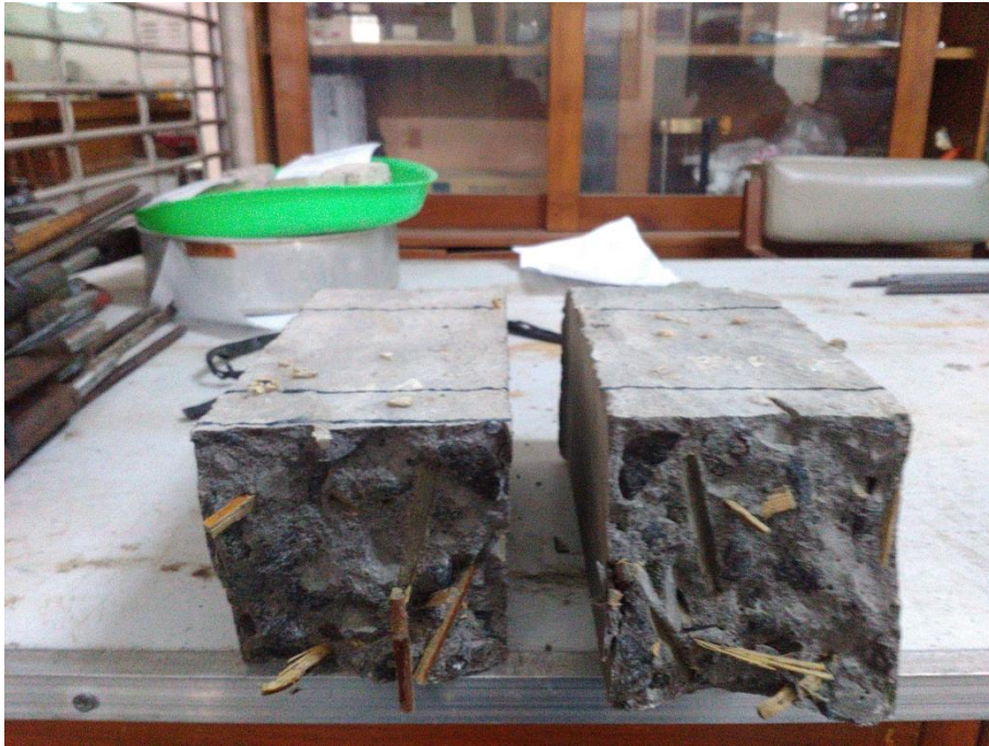
Gambar L-7.5 Hasil Pengujian Kuat Lentur Balok Beton BSR 2