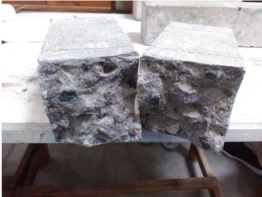
Gambar L-7.1 Hasil Pengujian Kuat Lentur Balok Beton BN