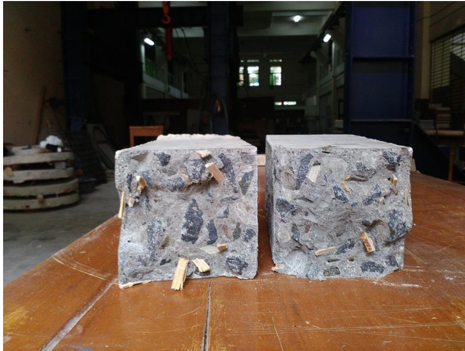
Gambar L-7.3 Hasil Pengujian Kuat Lentur Balok Beton BSR 1