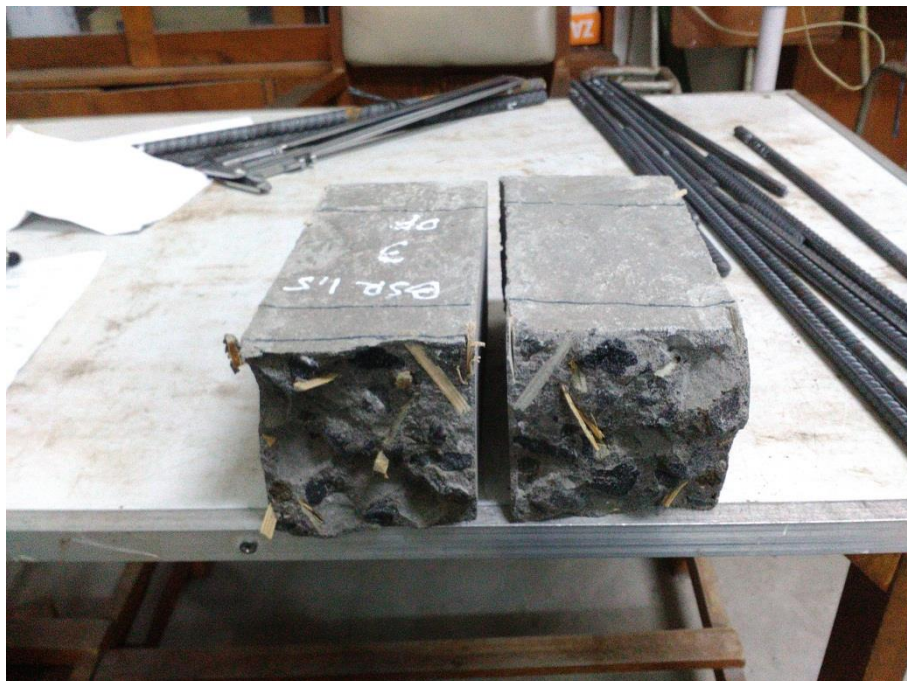
Gambar L-7.4 Hasil Pengujian Kuat Lentur Balok Beton BSR 1,5