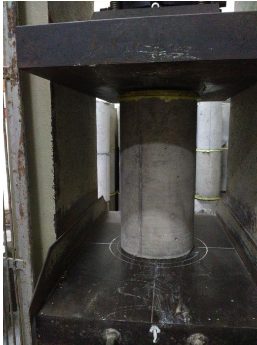
Gambar L-3.1 Pengujian Kuat Tekan Beton