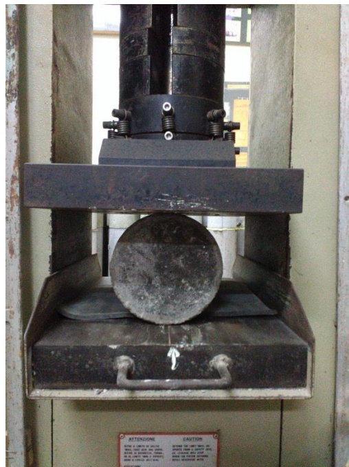
Gambar L-3.2 Pengujian Kuat Tarik Belah Beton