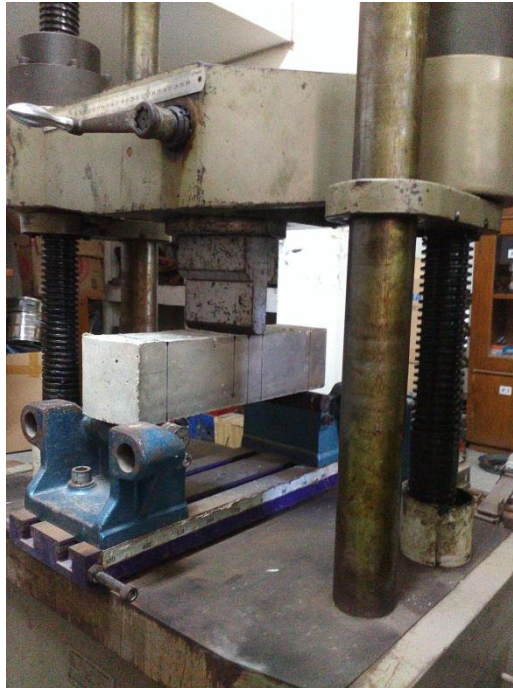
Gambar L-3.3 Pengujian Kuat Lentur Balok Beton