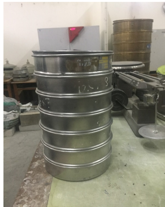
Gambar L-1.2 Saringan