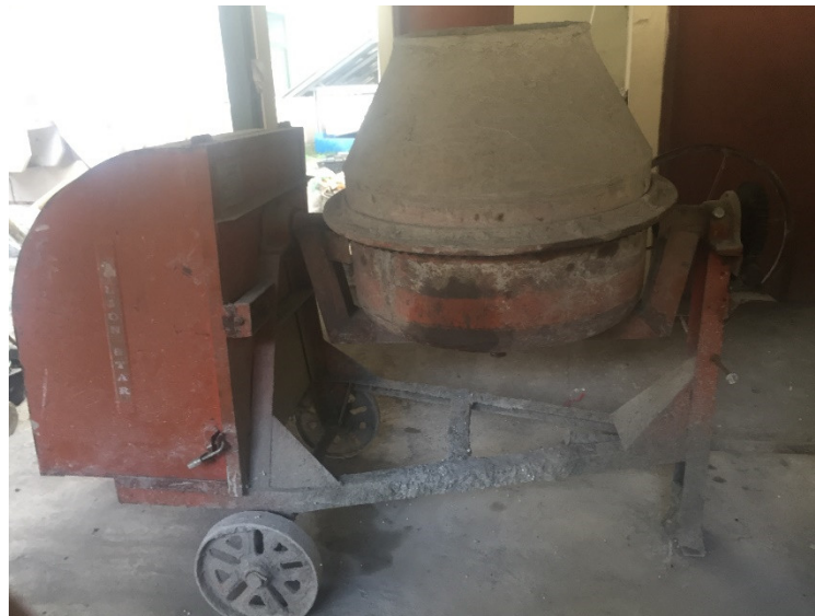
Gambar L-1.9 Mesin Pengaduk Beton