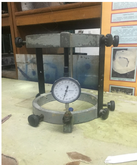
Gambar L-1.10 Dial Gauge