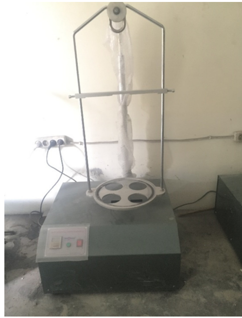
Gambar L-1.3 Mesin Saringan