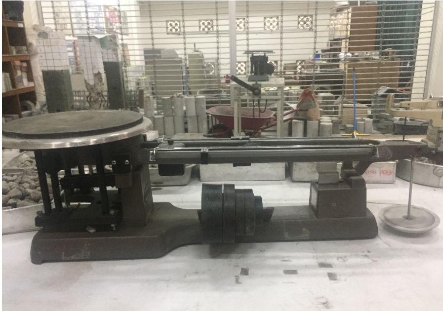
Gambar L-1.5 Timbangan Kapasitas 20000 gram