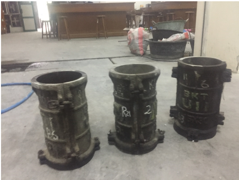
Gambar L-1.8 Cetakan Benda Uji