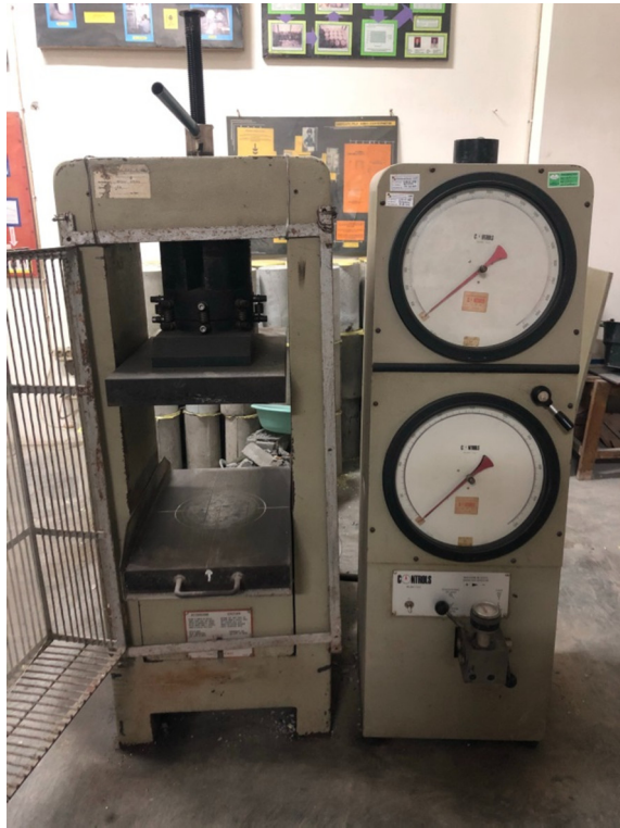
Gambar L-1.13 Compressing Testing Machine (CTM)