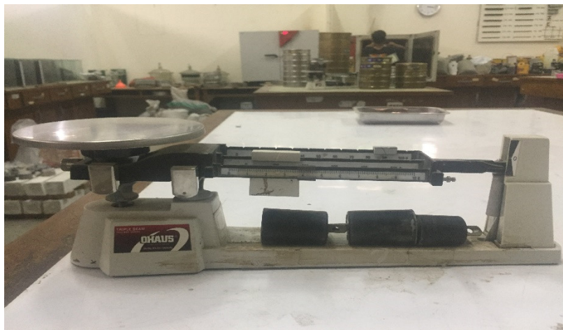
Gambar L-1.4 Timbangan Kapasitas 2500 gram