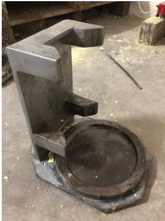
Gambar L-1.12 Cetakan Capping Silinder