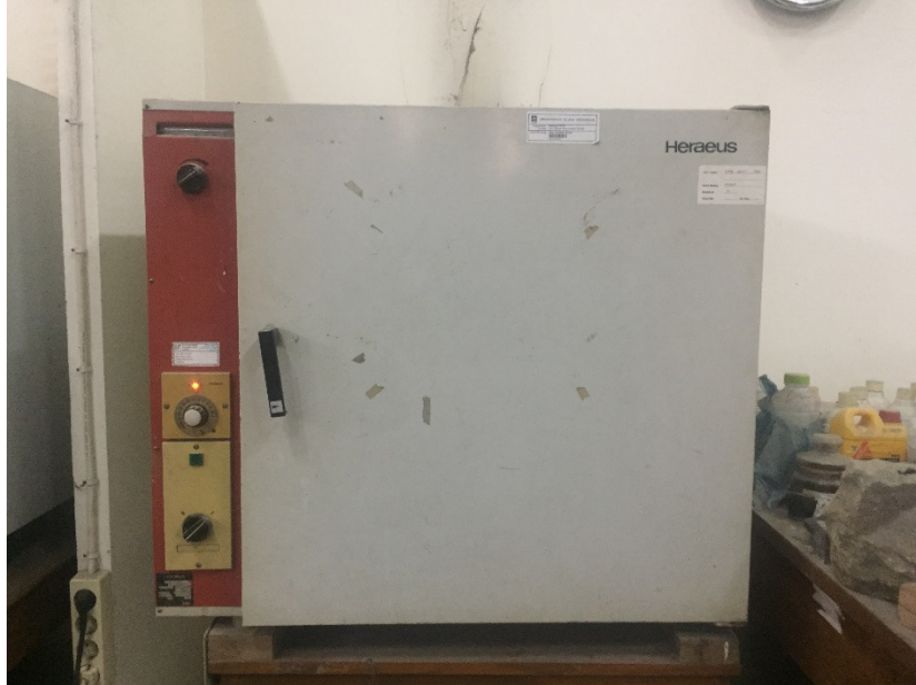
Gambar L-1.7 Oven