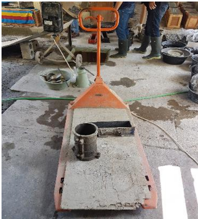
Gambar L-1.16 Troli Barang