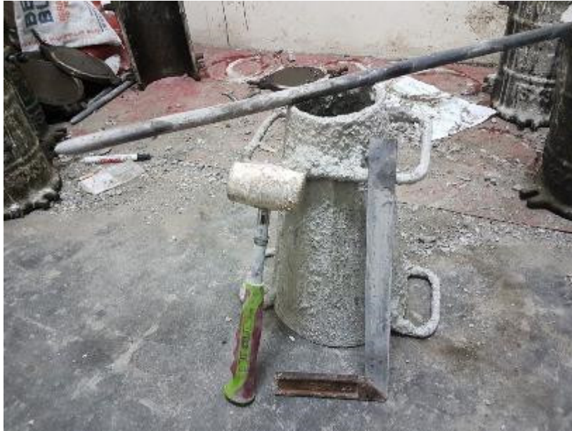
Gambar L-1.11 Alat Pengujian Slump