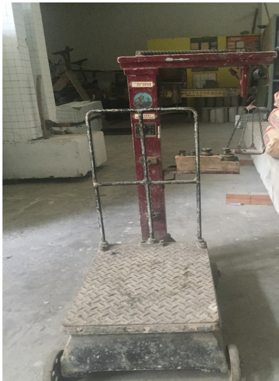
Gambar L-1.6 Timbangan Duduk Kapasitas 150 kg