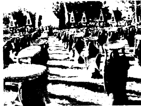
Gambar 1.4. Atraksi budaya pada masa panen