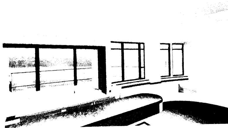
Gambar 4.13. Kamar marina resort hotel

resort agar tidak mengganggu aktifitas dari penghuni. Untuk kamar hotel resort ditempatkan saling berhadapan antara kamar satu dengan kamar lainnya serta berjejer yang dipisahkan oleh koridor didalam hotel resort tersebut. Dalam kamar hotel dirancang agar dapat memberikan view kearah bukit dan laut/pantai.