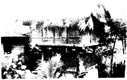
Gambar 1.3. Lenge (Lumbung Padi)

Masih di sekitar Wawo, terdapat pula lumbung tradisional dengan ciri khas Bima. Lumbung yang dikenal dengan sebutan lengge yang berderet panjang merupakan bangunan khas tempat penyimpanan beras yang lokasinya berdiri sendiri di luar pemukiman penduduk yang merupakan Desa Wisata.