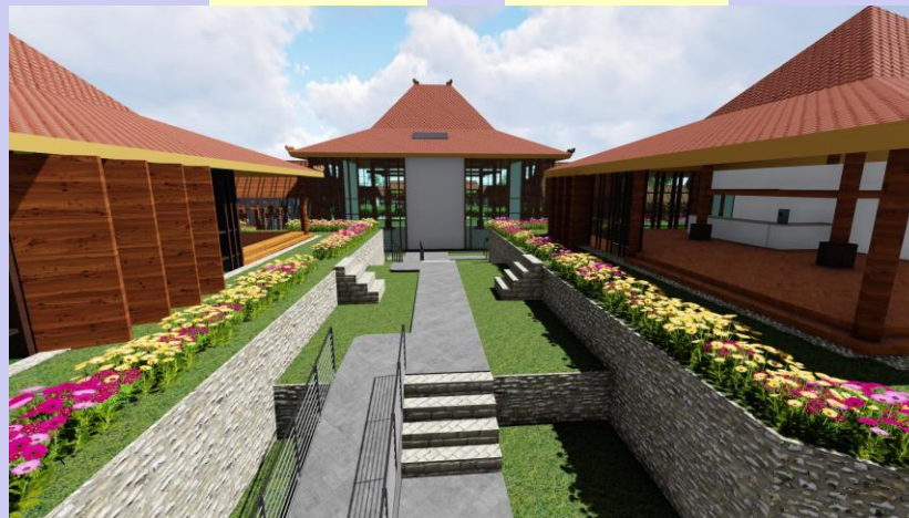
Gambar 5.3 Akses antara bangunan restoran satu dengan yang lainnya