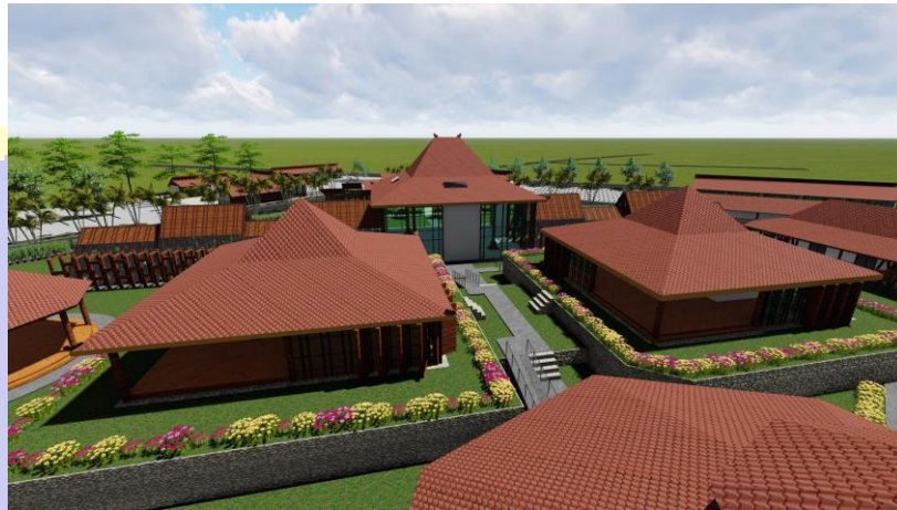
Gambar 5.2 Dua bangunan restoran yang terpisah