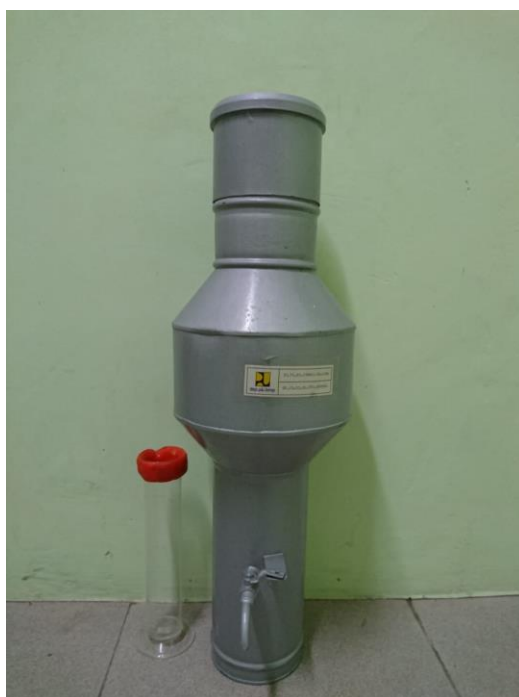
Gambar L-2.5 Penakar Hujan Manual