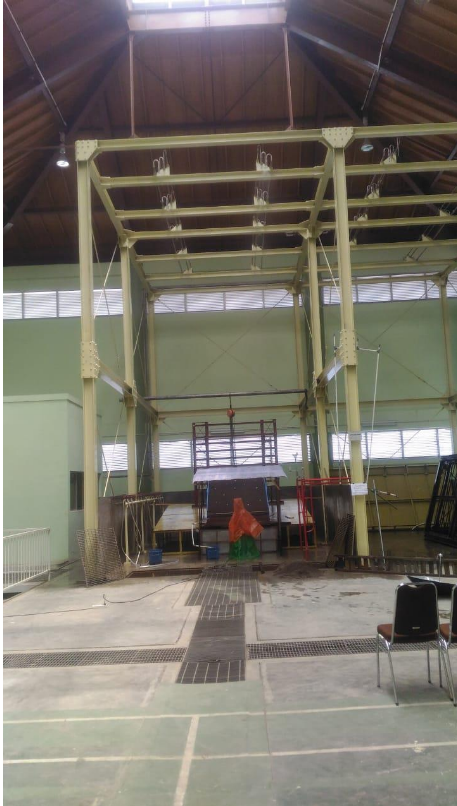
Gambar L-2.3 Artificial Rainfall Apparatus