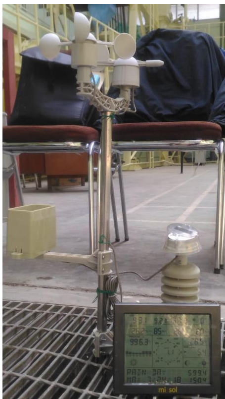
Gambar L-2.4 Alat Penakar Hujan Otomatis