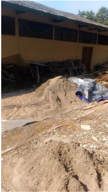
Gambar L-2.1 Sedimentasi Pasir Merapi