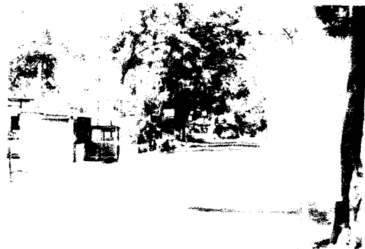
Gb.Area pemukiman di Selatan Site