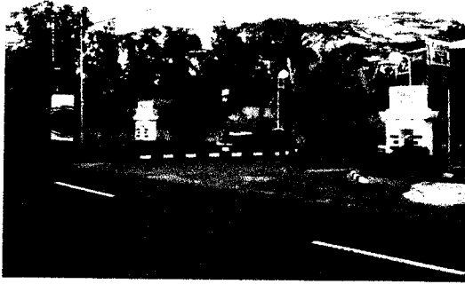
Gb.G. Jalan Masuk dengan Dua Akses