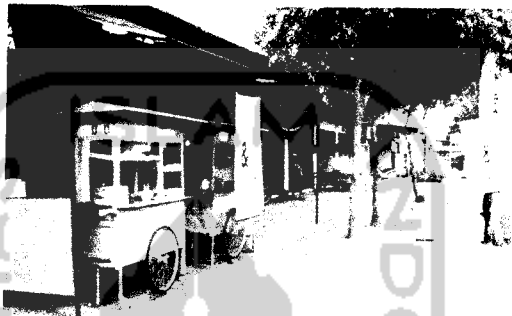
Gb.I. Sentra Industri Kecil di Timur Site