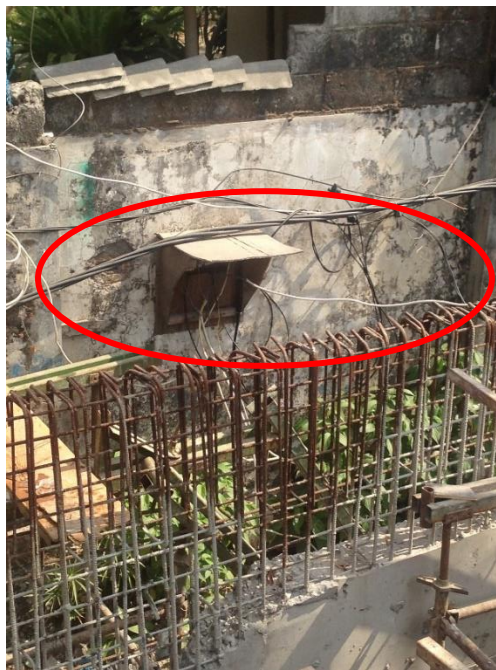
Gambar L-1.2 Kabel yang Tidak Rapi