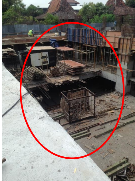
Gambar L-1.1 Area Kerja Berantakan