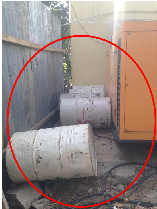
Gambar L-1.4 Bahan Mudah Meledak Dekat Dengan Generator Listrik