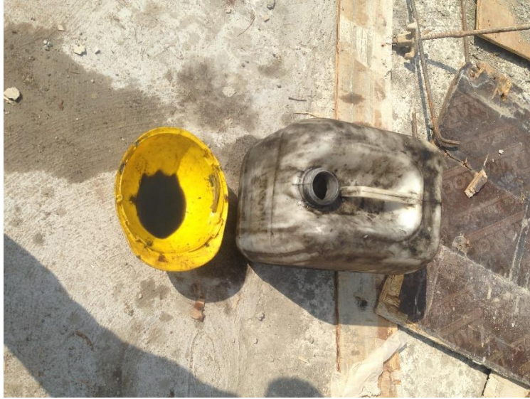
Gambar L-1.7 Sisa Bahan Bakar Tidak Langsung di Bereskan