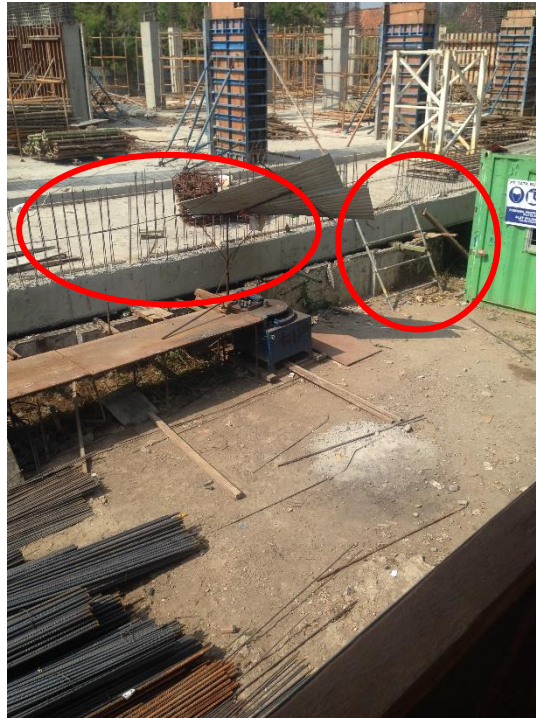
Gambar L-1.5 Kondisi Area yang Tidak Aman