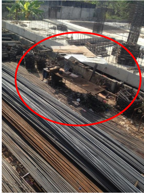
Gambar L-1.3 Kondisi Area Pembesian Sempit dan Kotor