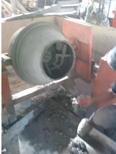
GAMBAR 3 PEMBUATAN / PROSES MIXING