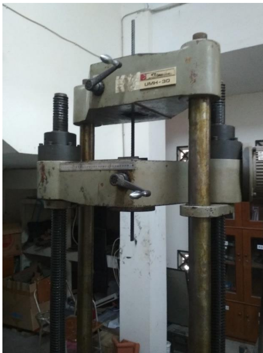
GAMBAR 12 UJI TARIK BAJA