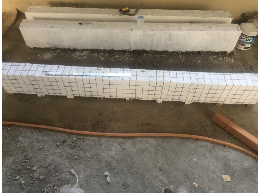
GAMBAR 15 BENDA UJI BALOK BERTULANG 28 HARI