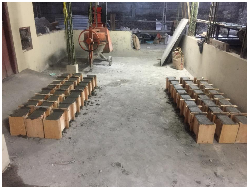
GAMBAR 14 BENDA UJI BALOK BERTULANG SETELAH DI COR