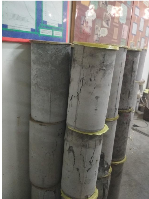
GAMBAR 10 BETON SETELAH DITEKAN