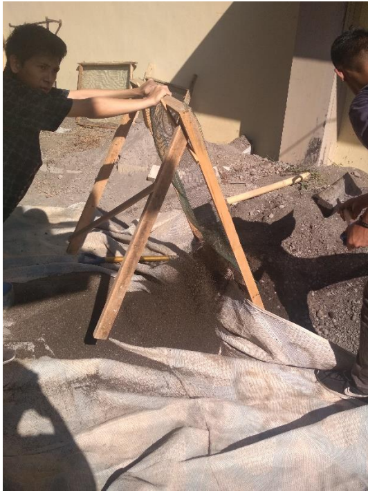
GAMBAR 1 PENYARINGAN AGREGAT HALUS