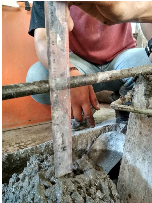
GAMBAR 4 UJI SLUMP