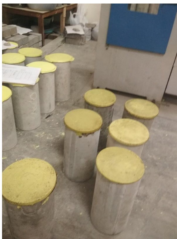
GAMBAR 8 PROSES CAPING