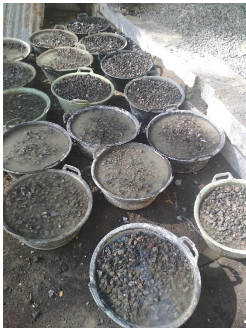
GAMBAR 2 PERSIAPAN AGREGAT KASAR