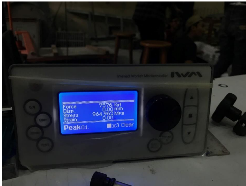
GAMBAR 17 PEMBACAAN KUAT LENTUR