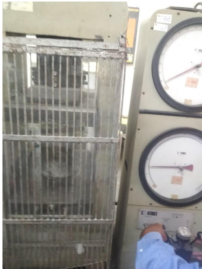
GAMBAR 9 UJI TEKAN BETON