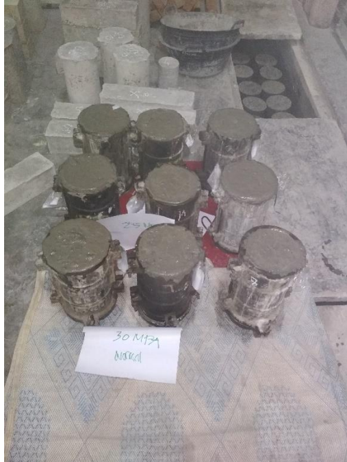
GAMBAR 5 BENDA UJI PADA SAAT MASIH DI BEKISTING