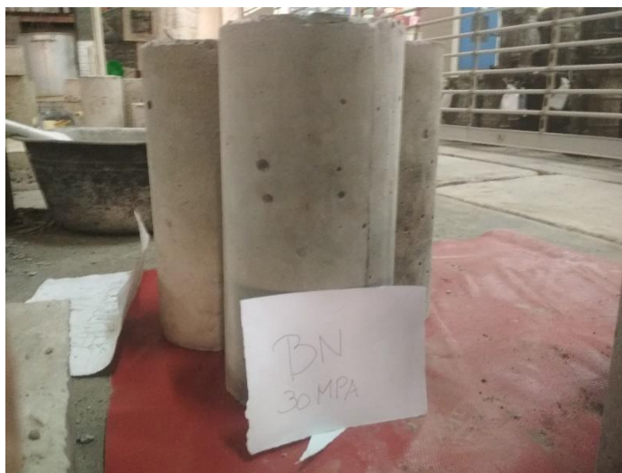
GAMBAR 7 BENDA UJI SIAP DI UJI