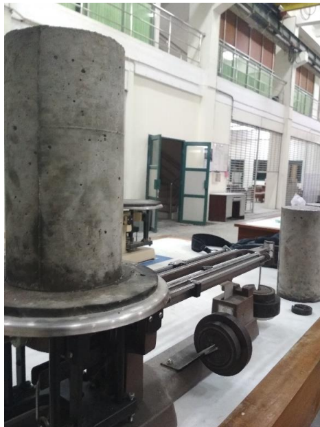
GAMBAR 6 MENIMBANG BERAT BETON