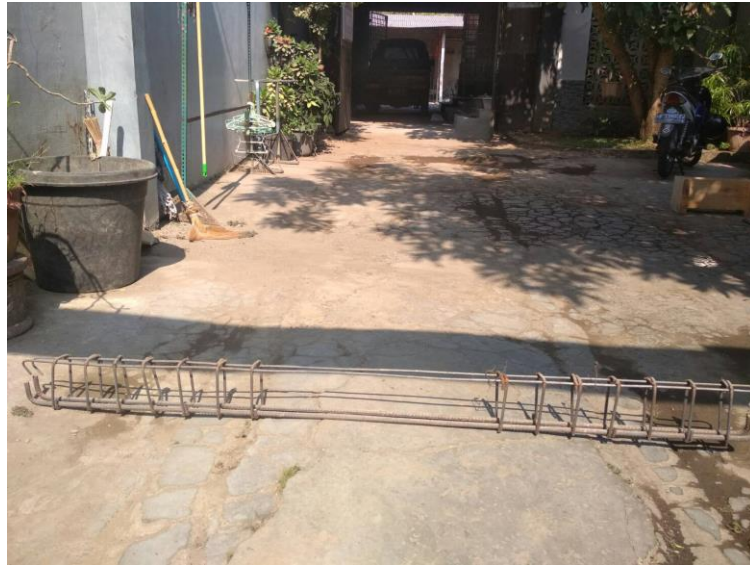
GAMBAR 13 PENULANGAN