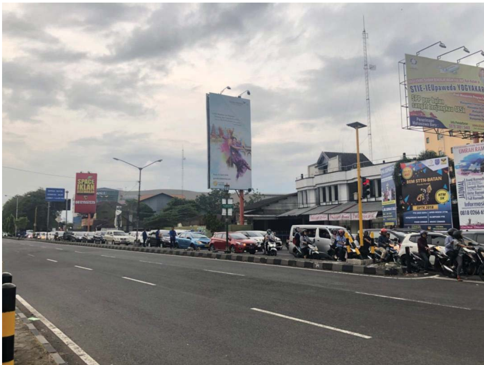
Gambar L-2.2 Panjang Antrian Lengan Timur