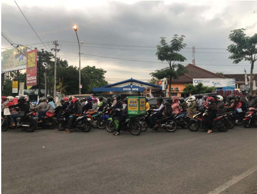
Gambar L-2.3 Kepadatan Lengan Utara