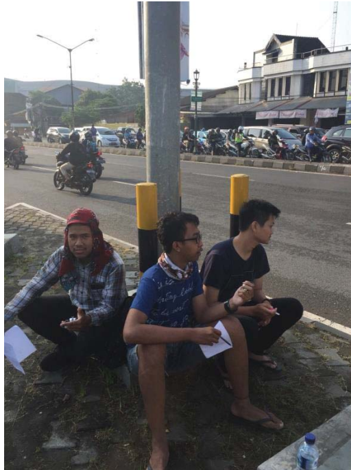
Gambar L-2.1 Pengambilan Data Lalu Lintas