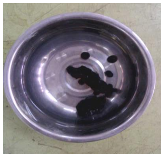
Aspal / Bitumen