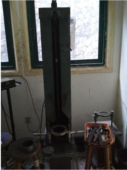
Satu set Alat Penumbuk