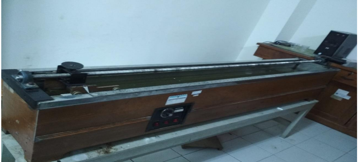
Mesin Uji Daktilitas