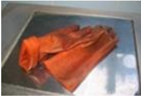
Water Bath dan Sarung Tangan