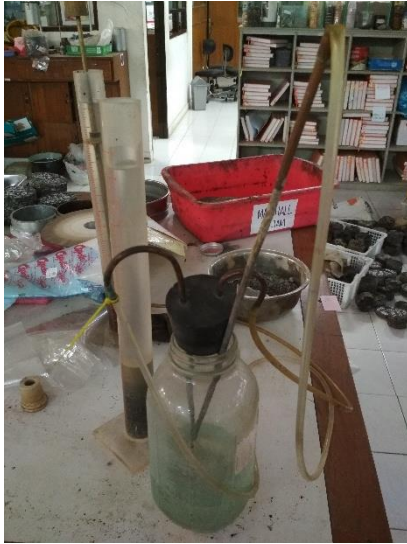
1 Set Alat Pengujian