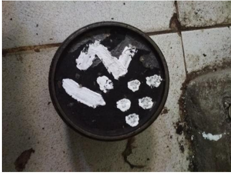
Benda uji sebelum di uji