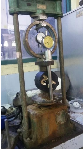
Alat Pengujian ITS