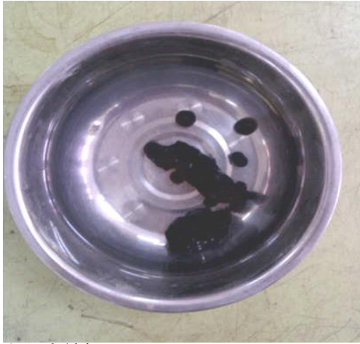
Aspal / bitumen