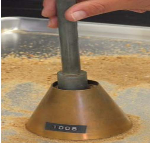
Cone dan Penumbuk