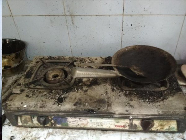
Wajan dan Pengaduk