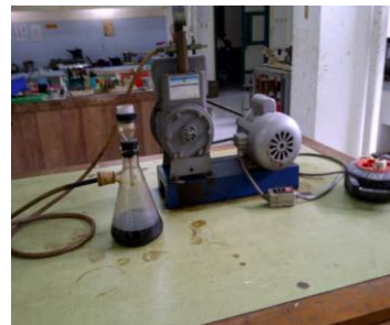
Alat / Pompa Hisap