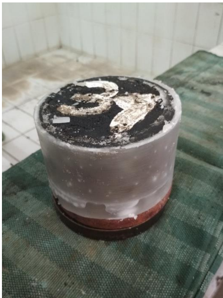
Benda uji saat uji Permeabilitas