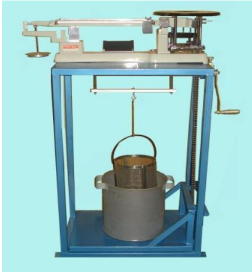
Timbangan + Keranjang kawat