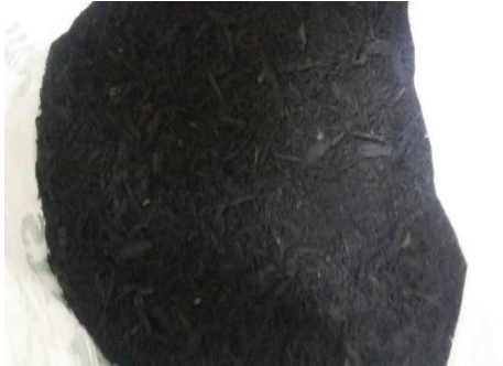
Serbuk Ban Karet Sebelum di Saring