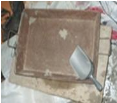
Cetok dan Wadah