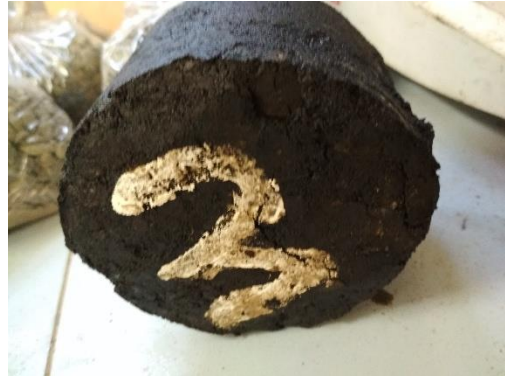
Benda uji Setelah di uji Marshall