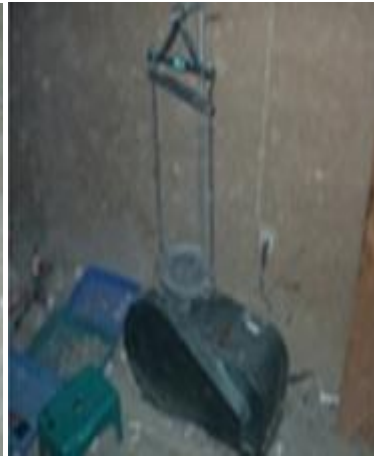
Alat Penguncang saringan