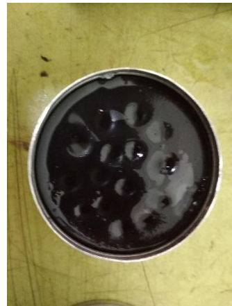
Cawan Berisi Aspal