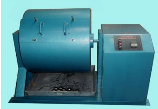
Mesin Los Angeles