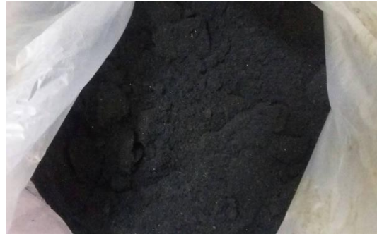
Serbuk Ban Karet Tertahan Saringan #50