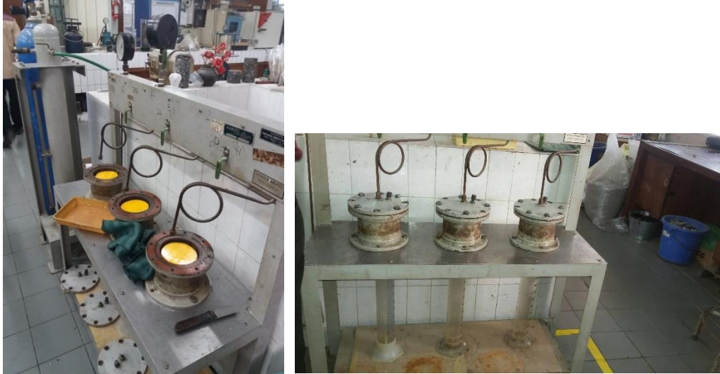
Alat Pengujian Permeabilitas