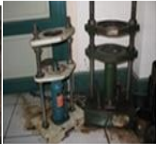
Ejector (Hydrolic Pump)