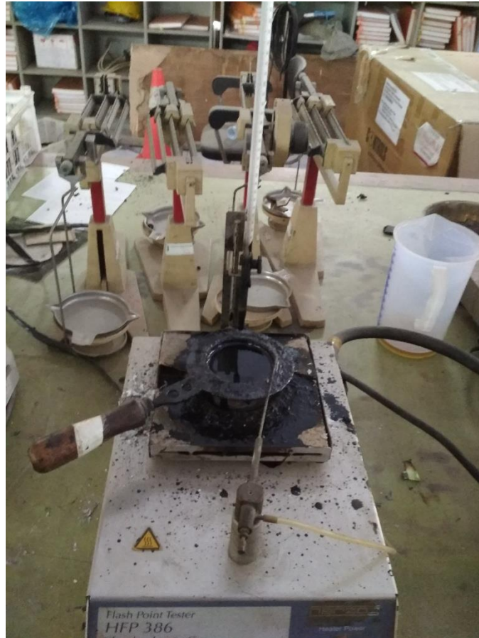
Alat pengujian titik nyala dan titik bakar aspal