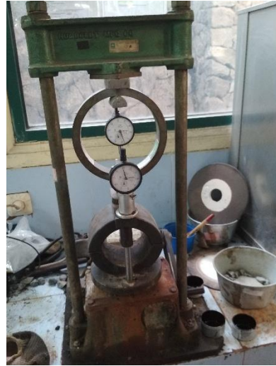
Alat Pengujian Marshall dan Immersion