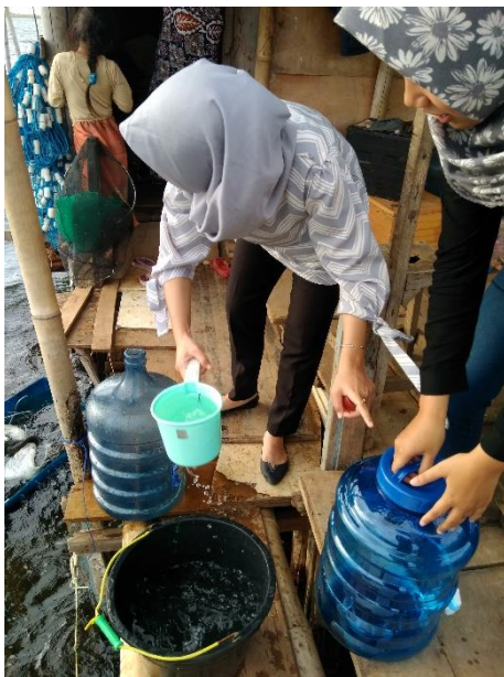
Air Laut/ RobSemarang