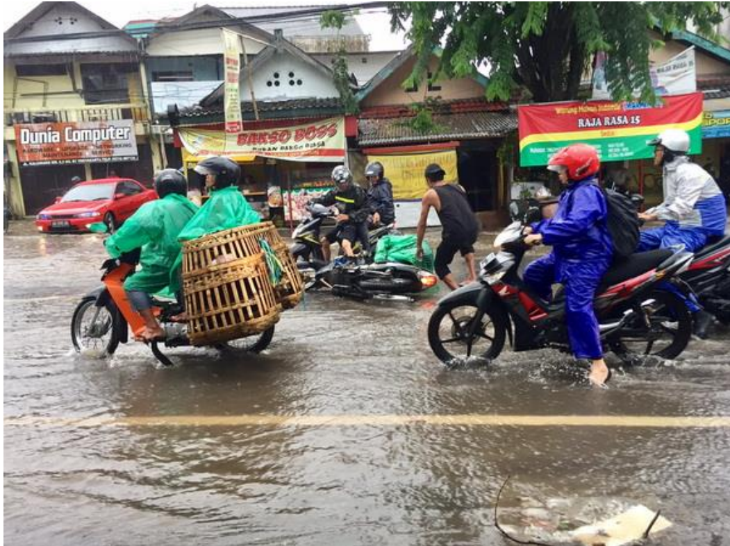
Lampiran 4. Foto Lokasi Jalan Kaliurang KM 4,5, sebelah MM UGM.