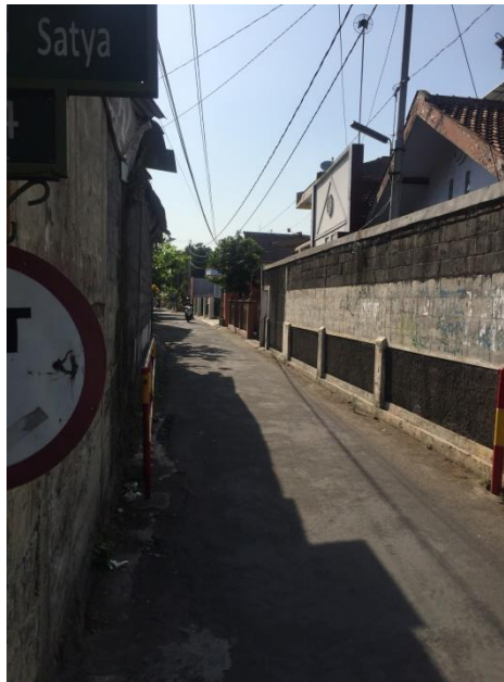
Lampiran 6. Foto Lokasi Jalan Pandega Wreksa.