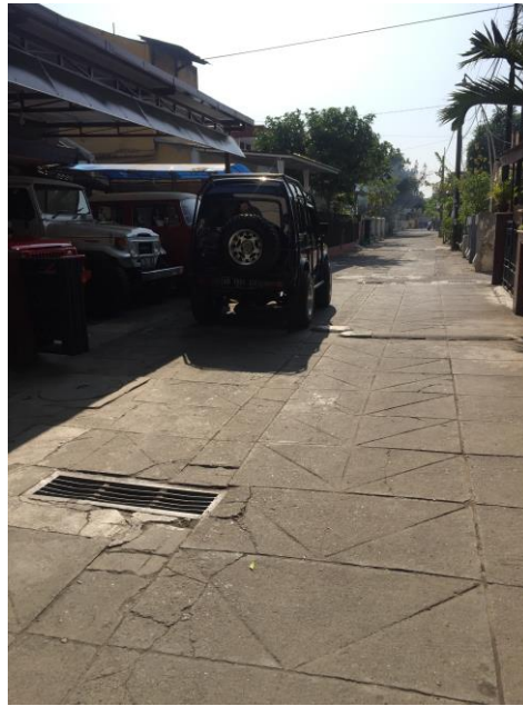
Lampiran 14. Foto Lokasi Jalan Mijil.