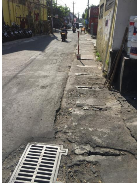
Lampiran16. Foto Lokasi Jalan Kenari.