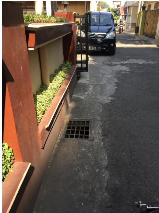
Lampiran 24. Foto Lokasi Jalan Kaliurang Barat.