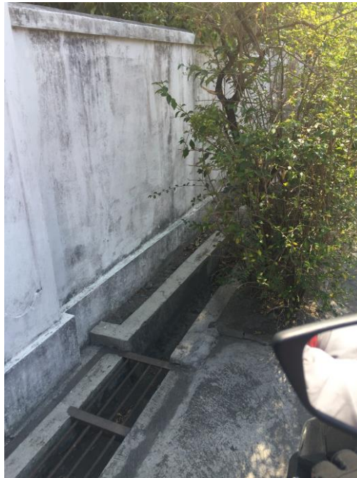
Lampiran 20. Foto Lokasi Jalan Saimndito.