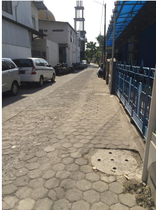
Lampiran 12. Foto Lokasi Jalan Grompol.