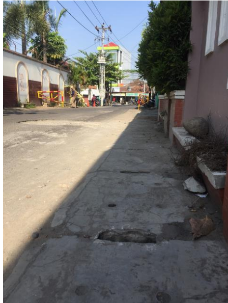
Lampiran 8. Foto Lokasi Jalan Pandega Mandala.